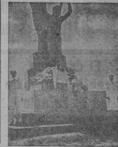
La Argentina celebró el XXII aniversario del vuelo del "Plus Ultra". Los miembros de la Aviación argentina rindieron homenaje ante el monumento que perpetúa el histórico vuelo del "Plus Ultra", depositando una corona de flores.