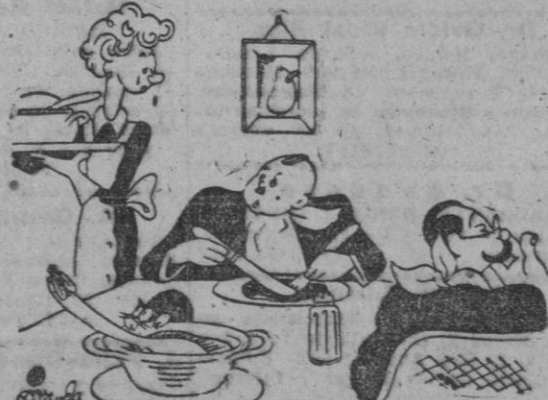
ROMPEPLATOS, por Miranda

—No me propongas hacer las paces, ¡que las hago!