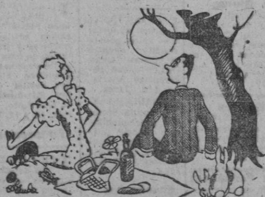
AMENAZA, por Miranda

—No me propongas hacer las paces, ¡que las hago!