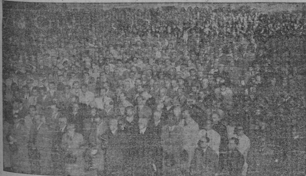
Millares de hombres y jóvenes coruñeses participaron anoche en el solemne Via-Crucis que recorrió las principales calles de la capital, desde la iglesia del Sagrado Corazón hasta la parroquial de San Nicolás. La procesión de penitencia constituyó una grandiosa e impresionante manifestación de fe religiosa.

El redactor diplomático de la Agencia Reuter hace constar que, aunque nadie excluye la posibilidad de que cuando orea llegado el momento Rusia plantee tal pretensión a Noruega, por ahora la política soviética en Europa se ha dedicado a consolidar la esfera de influencia al Este de la línea que quedó establecida por los países que aceptaron el plan Marshall. Se hace constar que sería considerado como de grave importancia el hecho de que Rusia se dirigiera a los países que aceptaron libremente la ayuda norteamericana con la intención de incluirlos en el bloque soviético.—(EFE).