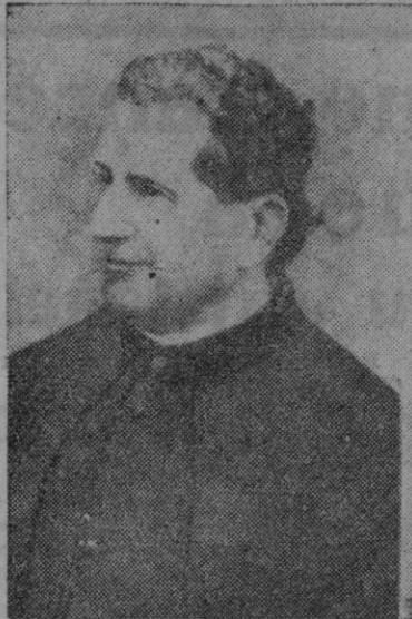
San Juan Bosco

Se celebra hoy la festividad de San Juan Bosco, de gran popularidad, Apóstol de la devoción a María Auxiliadora e insigne educador de la niñez y juventud, en los tiempos modernos. La jovialidad, el dinamismo y la confianza filial en el auxilio de María Santísima, son la característica de la actividad apostólica del Santo.