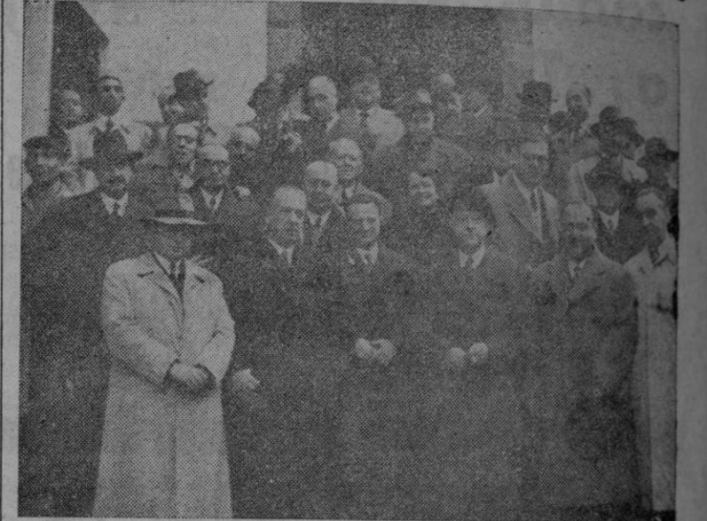
Autoridades y periodistas a la salida de la solemne función religiosa celebrada en la parroquia de San Pedro de Mezonzo

La Asociación de la Prensa tributó un cordial homenaje a varios de sus facultativos