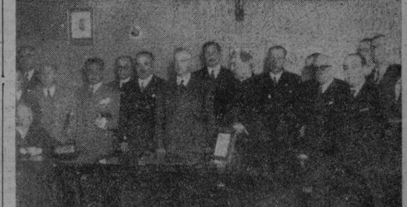
Los médicos que fueron objeto de un homenaje por los periodistas coruñeses, fotografiados en los locales de la Asociación de la Prensa, en unión de las autoridades.