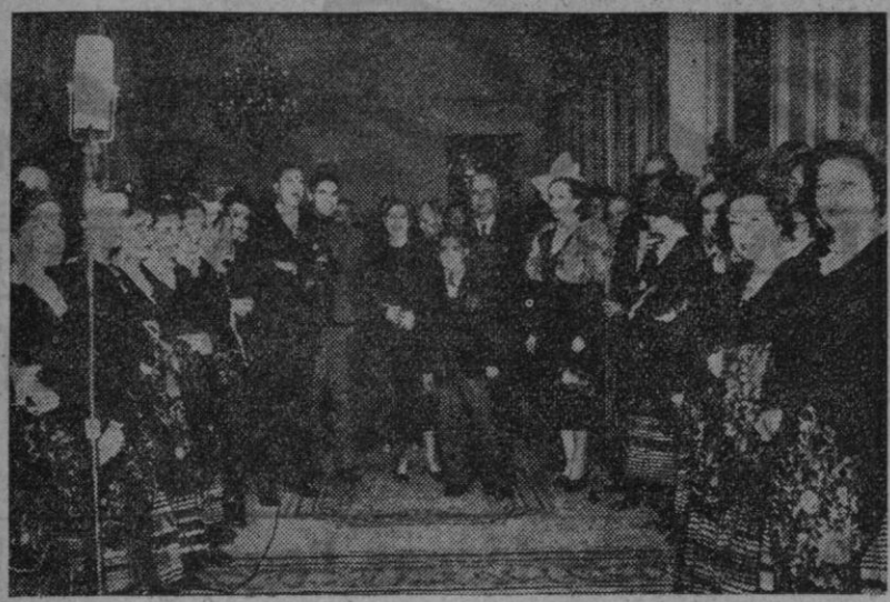
BOGOTÁ.—El Presidente, Mario Ospina, dió una fiesta en el Palacio Presidencial en honor de los Coros y Danzas españoles. Aquí se ve al primer mandatario de Colombia y su esposa, en compañía del ministro de España, don José María Alfaro, y un grupo de muchachas de los Coros.

EDITORIAL Energía y alimentación base del Plan bienal