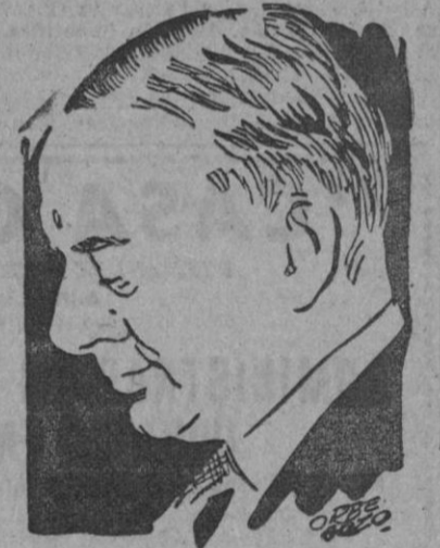
GEORGES BIDAULT Jefe del Gobierno francés

Se ha vuelto a anunciar que el jueves, fecha en que la marea alcanza su punto máximo, se intentará de nuevo las operaciones de salvamento.—(EFE)