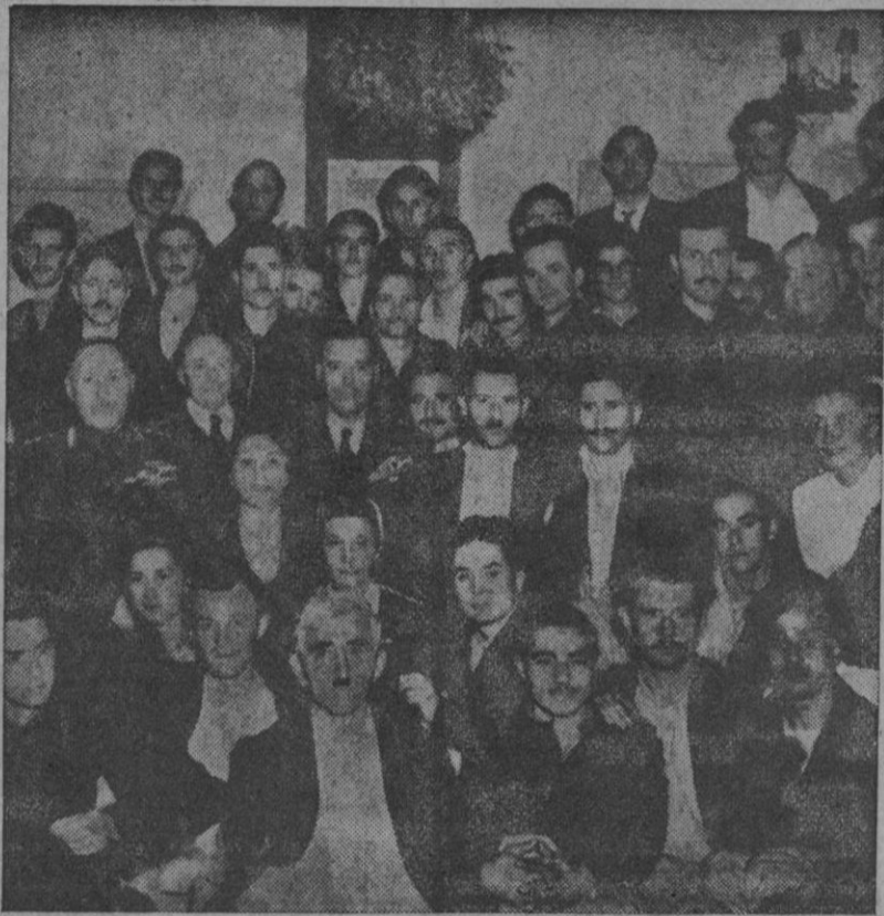
ATENAS.—Grupo de mutilados de guerra, acompañados de los jefes de los Hospitales Militares, reunidos en la Legación de España, donde el ministro de España en esta capital, Sr. Romero, los obsequió con una fiesta típica española.