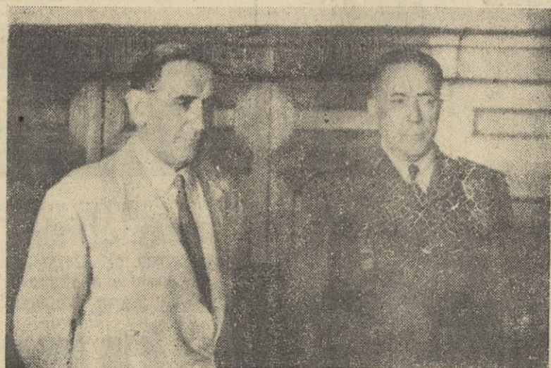
El ministro del Ejército, teniente general Muñoz Grandes, poco después de su llegada a La Coruña, en el despacho del capitán general de la Región, con quien aparece en la foto.