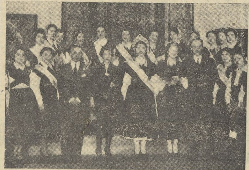
La nueva reina de la colectividad gallega de Buenos Aires, rodeada de su corte de honor, después de la ceremonia de la coronación

La Prensa bonaerense dedica gran atención a la biografía de la elegida