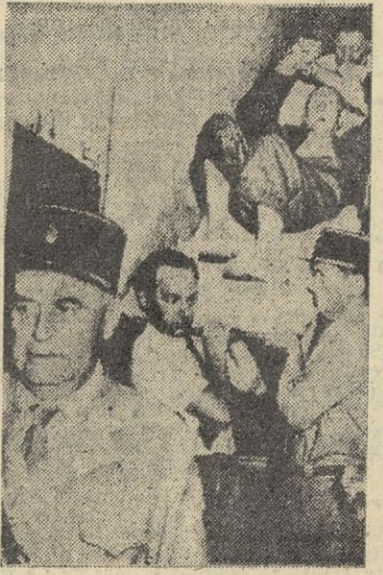
Uno de los ataques por la locura a causa del famoso pan de Pont Saint Esprit, en Francia, es conducido al Hospital en pleno ataque de demencia furiosa