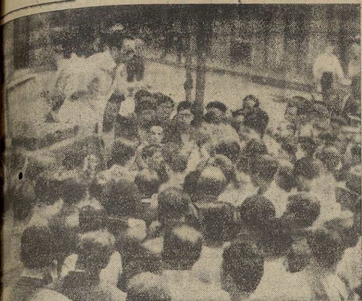
QUE MUCHO HABLA... MUCHO VENDE... "Yo no, le cobraré a diez, ni ocho, ni siete, ni seis..." Así, bajando, bajando parece darnos el artículo y una cantidad en metálico para tomar una cerveza. Pero no, esa es su técnica profesional, que maneja con impresionante verborrea y le produce resultados en estas tierras en que siempre estamos dispuestos a perder unos minutos y cinco pesetas en favor de cualquiera.