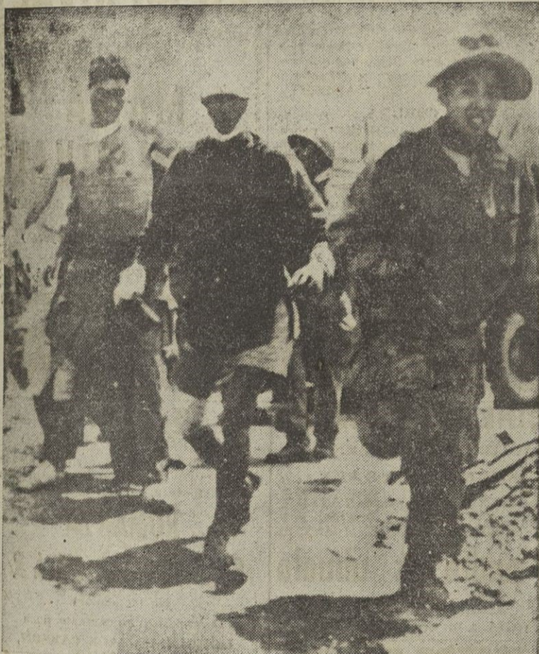
Trágica escena en Dien Bien Fu. Tres heridos, después de ser curados de urgencia, vuelven al puesto de combate para cubrir los huecos que dejaron otros camaradas muertos. Sólo así pudo mantenerse la heroica resistencia.

Resistió 56 días de terrible asedio Se desconoce la suerte del general De Castries