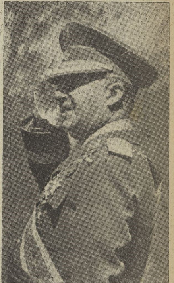
beneficiarios y las llaves correspondientes a los seis primeros vecinos. Después de visitar algunas de las viviendas, regresó al Gobierno Civil y se retiró seguidamente a descansar.

Una vez acabado el almuerzo, S. E. y acompañantes se dirigieron al pantano de Santa Teresa. Después de la bendición del pantano, el Generalísimo descubrió una placa conmemorativa del acto que se celebraba y accionó un mecanismo que puso en marcha las compuertas. Terminada esta inauguración Franco emprendió el viaje de regreso a Salamanca. Antes de entrar en la ciudad, se detuvo en la barriada de viviendas de "Nuestra Señora de la Vega", construida por el I. N. I. Tras ser bendecido el grupo, el Jefe del Estado entregó los títulos a los