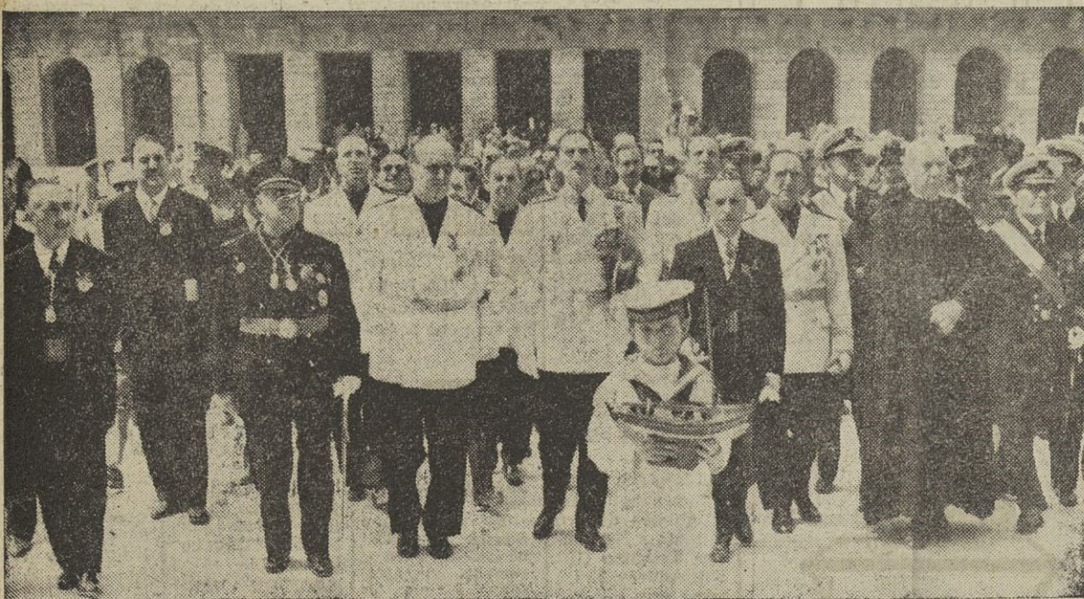
La presidencia de la peregrinación nacional de pescadores dirigiéndose a la catedral