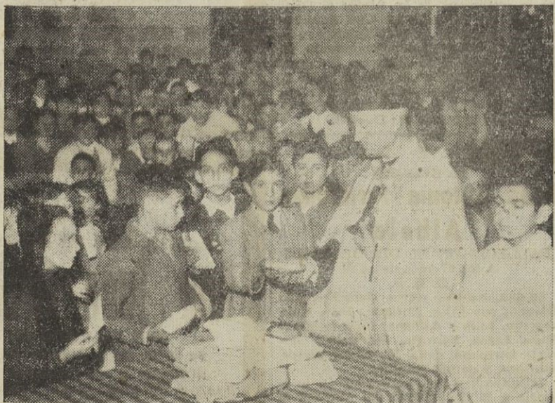
Niñas y niños de las escuelas de Santa María de Oza que se concentraron en la iglesia parroquial para ganar el jubileo del Año Mariano, e hicieron la ofrenda de sus ahorros para la campaña infantil pro-Seminario. El señor cura párroco les dirigió la palabra desde el púlpito, cantándose la Salve a la Virgen. Al piadoso acto corresponden estas fotografías.