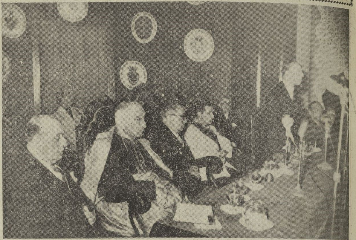
Se está celebrando en Valencia el III Congreso Nacional de Abogados. En la foto, el alcalde valenciano dando la bienvenida a los congresistas.