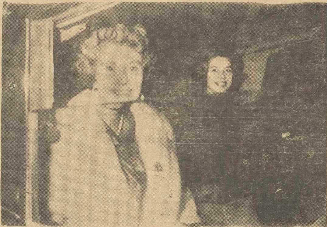
En la foto (Exclusiva), la reina Federica y la princesa Irene de Grecia saliendo del sanatorio de Loreto de Madrid, para retirarse al Palacio de la Moncloa, tras haber acompañado a la Princesa Sofia en el nacimiento de su primogénita. (FOTOFIEL).