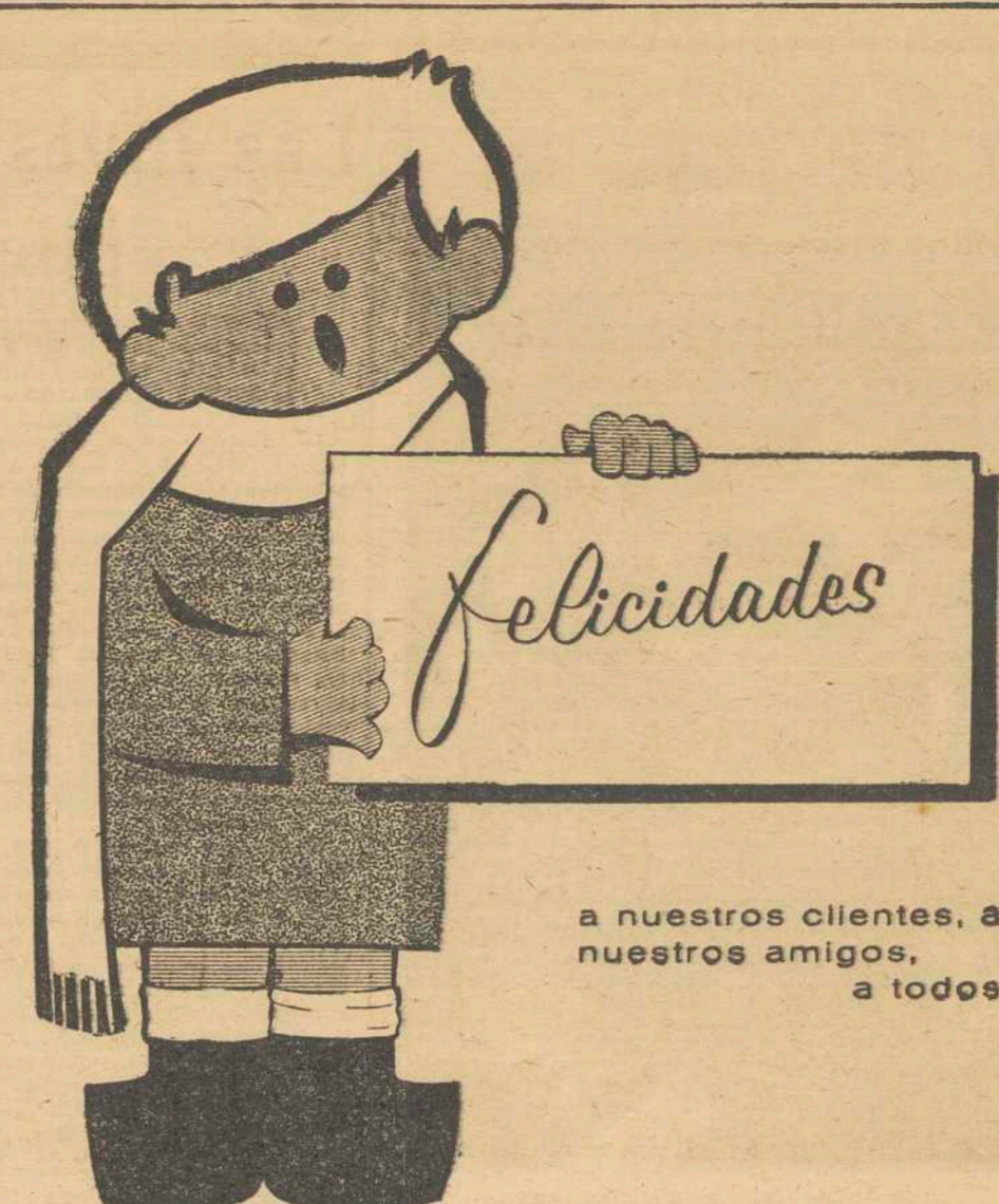
a nuestros clientes, a nuestros amigos, a todos.

TUNEL DE LA GUIA: Por la Dirección General de Transportes Terrestres del Ministerio