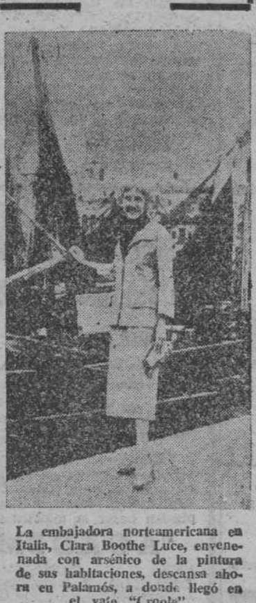
La embajadora norteamericana en Italia, Clara Boothe Luce, envenenada con arsénico de la pintura de sus habitaciones, descanza ahora en Palmira, a donde llegó en el yate "Croole".