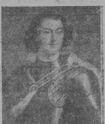
Pedro el Grande de Rusia