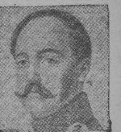
Nicolás I, emperador de Rusia