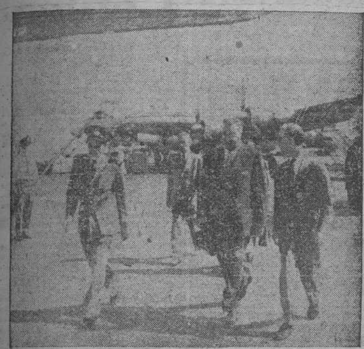
El ministro español de Asuntos Exteriores, don Alberto Martín Artaño, en el aeropuerto de Barajas momentos antes de salir para Londres.