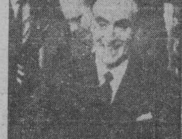
El Marqués de Santa Cruz, subsecretario de Asuntos Exteriores, en la Comisión Política principal de la O. N. U., momentos después de la brillante intervención en que expuso la postura de España acerca del problema del desarme.

Finalmente dedicó un saludo a la Alemania ausente y dijo que España quería ver figurar a este país en un conclave económico como éste. Efe.