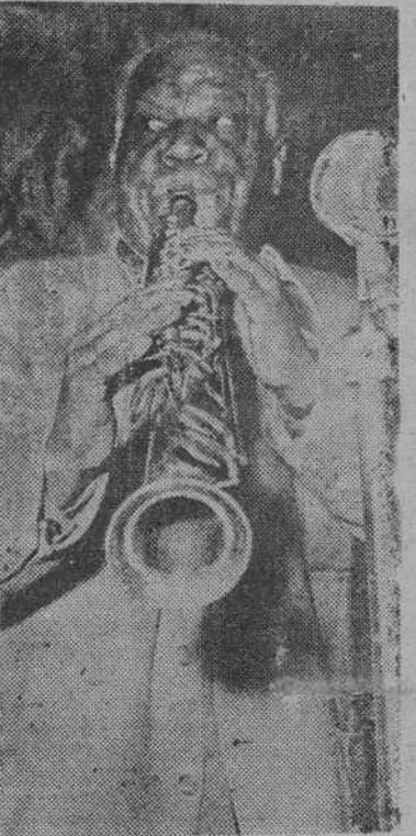
Sidney Bedet, admirado mundialmente por sus cualidades como saxofonista, que ha fallecido recientemente en Garbes