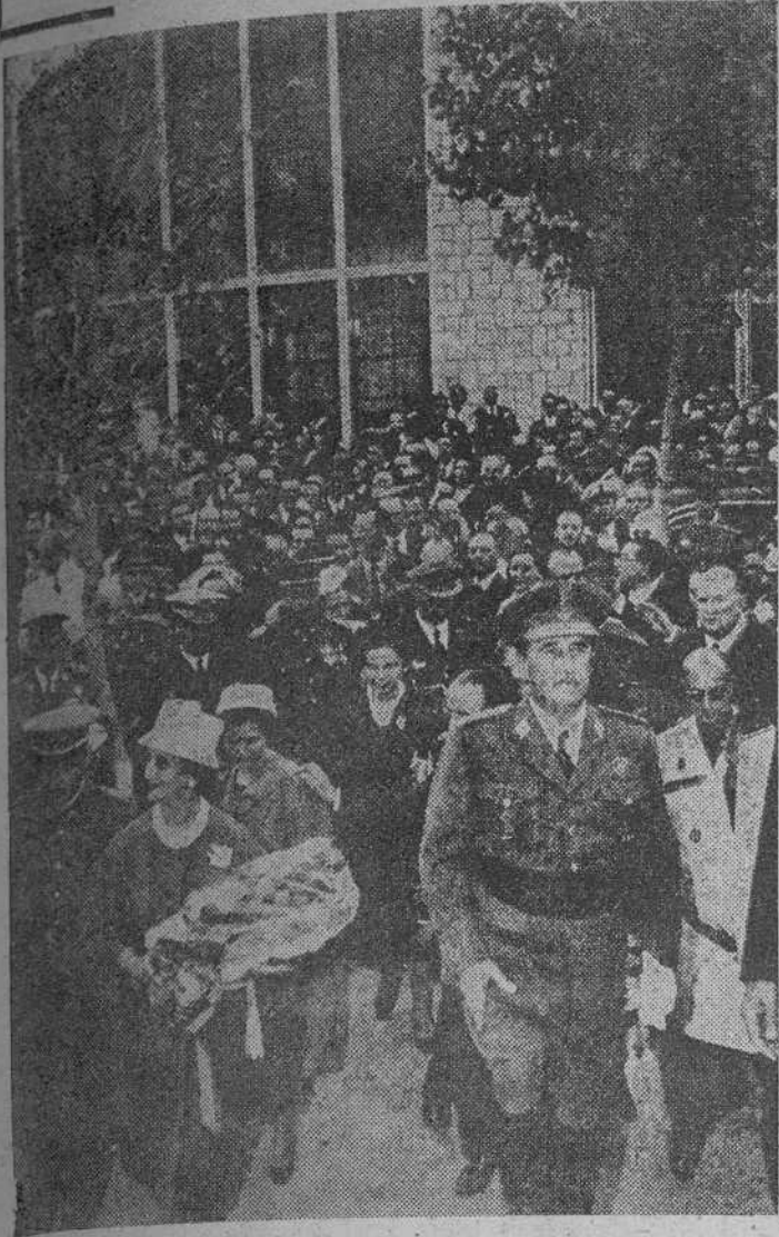
SS. EE. el Generalísimo Franco y esposa, en la inauguración de la IV FERIA Internacional del Campo. Al certamen concurren tres mil expositores de treinta y dos países