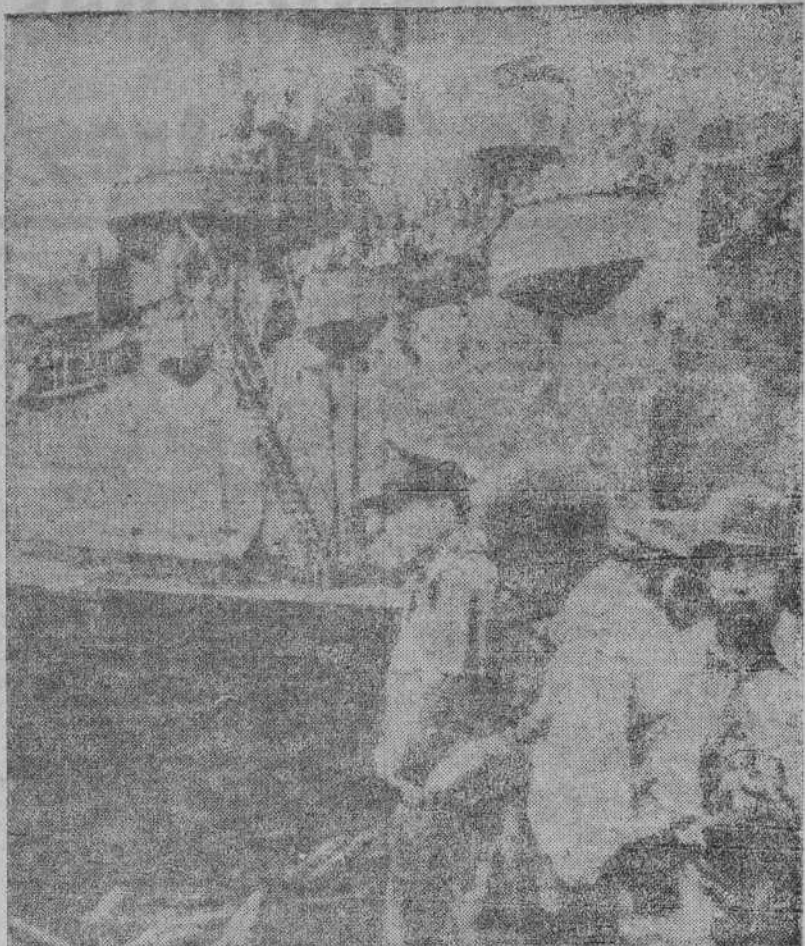
El general Mac Arthur, con sus tropas, en uno de los desembarcos realizados en las Filipinas