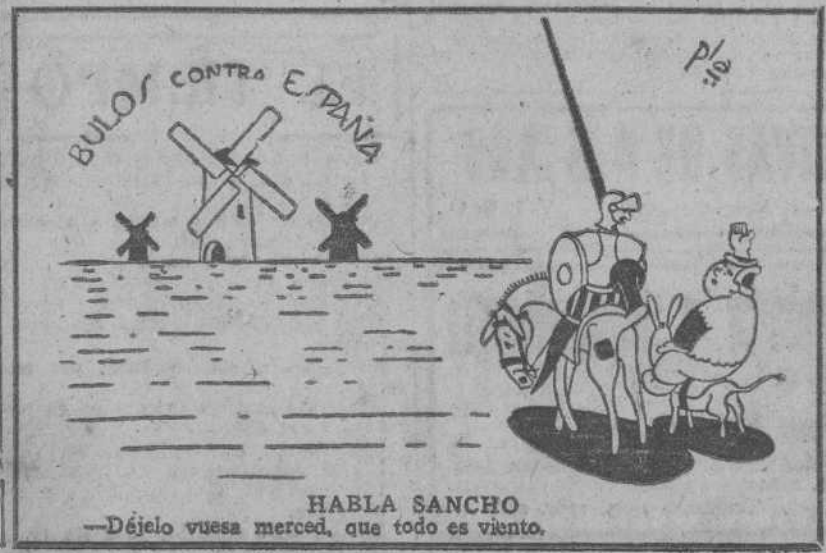
HABLA SANCHO —Déjelo vuesa merced, que todo es viento.

blicado hace unos días en el periódico "Estrella Roja", diario del Ejército ruso. Esto es en verdad muy sintomático. Por un lado, los aliados procuran aproximarse a Rusia al Vaticano, pero por otro, el periódico del Ejército ruso ataca al Papa.—(EFE.)