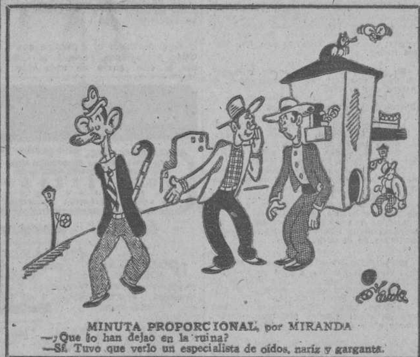
MINUTA PROPORCIONAL, por MIRANDA —¿Que lo han dejado en la ruina? —Sí. Tuvo que verlo un especialista de oídos, nariz y garganta.

BERLÍN, 12.—Después de cincuenta días y cincuenta noches de duros combates, los defensores de Budapest siguen luchando heroicamente contra fuerzas numéricamente superiores. Se libraron duros combates por la posesión de la ciudadela, del castillo y de sus alrededores. Se lucha literalmente por cada casa, por cada habitación y por cada tramo de calle.—(EFE).