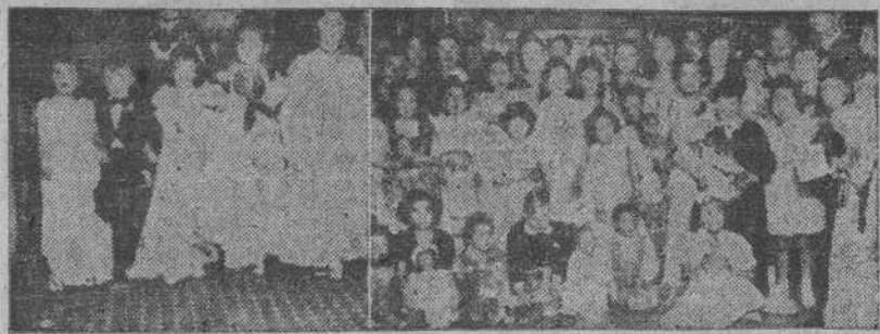
Niñas y niños vestidos con exquisito y delicado gusto y que concurrieron a la fiesta infantil del domingo, organizada por la Prensa

El domingo finalizaron los actos organizados por los periodistas en honor de los niños. Se repartieron entre los pequeños preciosos juguetes, figurando entre los premiados, por el gusto con que estaban ataviados, los niños siguientes: