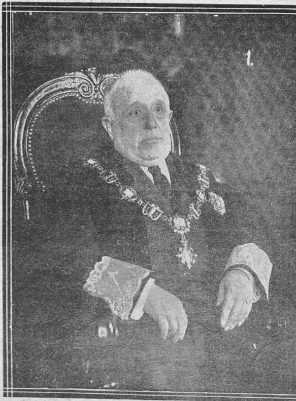
1. Don Diego Medina, que acaba de ser elegido presidente del Tribunal Supremo.