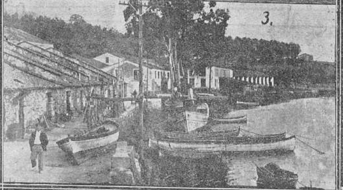
2. Un aspecto del puerto de Corme, cuyas obras acaban de ser subastadas. 3. El puerto de Puentevedra.