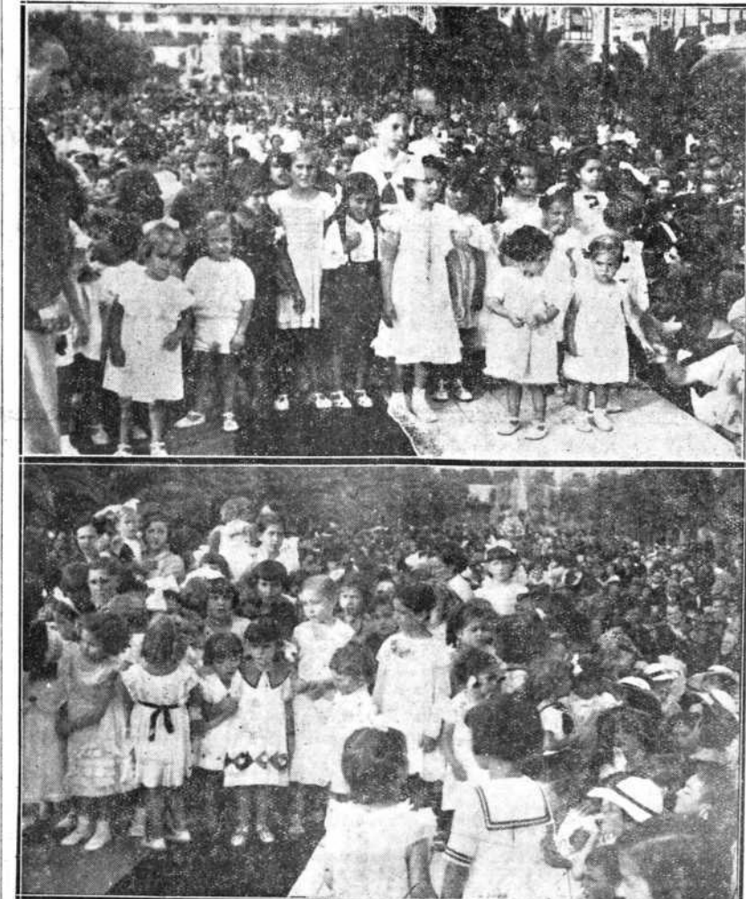
1. Dos momentos y grupos de niños que tomaron parte en el concurso de belleza infantil celebrado el miércoles en el parque de Méndez Núñez. (Fotos Artús y Blanco).