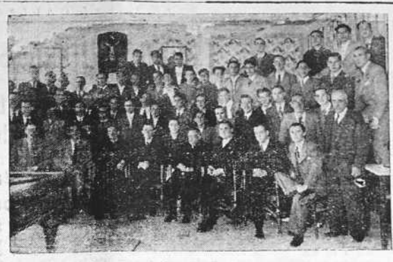
Los antiguos alumnos salesianos reunidos con motivo de su fiesta anual.

SEVILLA 8.—En el Colegio de Abogados se celebró junta general para proceder a la elección de una directiva. Había dos candidaturas, una de derechas y otra patrocinada por los amigos del ministro de Justicia señor Blanco Garzón y formada por elementos de Izquierda y Unión Republicana. De 202 votos emitidos, 183 fueron para la candidatura de derechas.