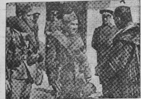
El general Varela interrogando en uno de los sectores del frente de Madrid a dos soldados "gubernamentales" que se han pasado a nuestras líneas

La Coruña.—Año XXI.—Núm. 5.320 DOMINGO, 14 MARZO DE 1937 Avenida de Rubine, 10. Tel.º: Dirección y Redacción 1177. Admón. 1542