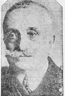
rina, ha muerto en Madrid de hambre. Esta es la trágica noticia que llega a nosotros.

Copiamos de “El Pueblo Gallego”: EL FERROL.—Don Honorio Cornejo Carvajal, ex ministro de Ma-