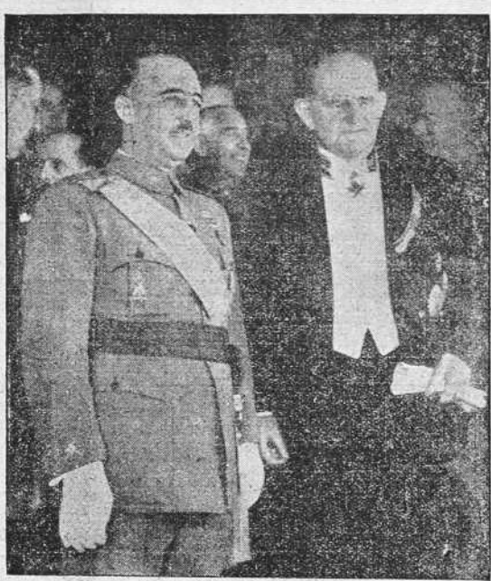
Nuestro Caudillo y Jefe del Estado Español, Generalísimo Franco, fotografiado con el Embajador de Alemania, General Faupel, después de haber presentado éste sus cartas credenciales.

PARIS. 13.—En los medios políticos se ha comentado mucho el hecho de que el jueves por la tarde se hubiesen reunido a la misma hora los comités rojos de Valencia, Barcelona, Sástago y Bilbao. De ninguna de las cuatro reuniones