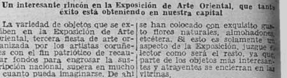
Un interesante rincón en la Exposición de Arte Oriental, que tanto éxito está obteniendo en nuestra capital