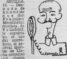
SEVILLA. 13.—Después de una charla de un día en el cuartel de Mendizábal, el general Queipo de Llano comentó a una charla...

los marxistas respetaban y protegían a la Iglesia. Dos monjes de un convento de Tarrasa comparecieron ante el tribunal popular y para presenciar la vista fueron llamados los extranjeros de una comisión que estaba visitando Cataluña. Al no presentarse defensor alguno, el tribunal invitó a los espectadores a que uno de ellos se encargara de la defensa. Las monjas fueron absueltas y los extranjeros se creyeron la farsa, pero a la mañana siguiente aparecieron en la Rabassada los cadáveres de las dos monjas.