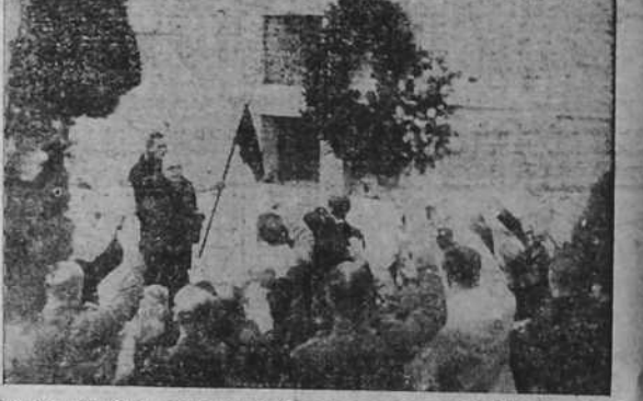
La Guardia Civil rinde homenaje a la memoria de Roldán, fundador de las JONS en La Coruña. (Foto EL IDEAL GALLEGU).