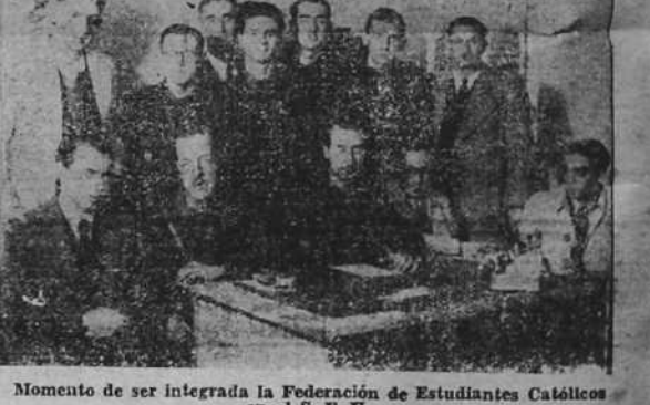
Momento de ser integrada la Federación de Estudiantes Católicos en el S. E. U. (Foto EL IDEAL GALLEGU).