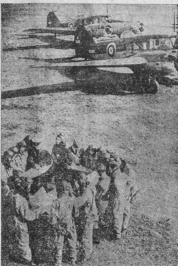
AVIONES INGLESES EN FRANCIA.—He aquí a los pilotos de las fuerzas aéreas inglesas en un aerodromo francés, recibiendo instrucciones para un reconocimiento sobre las líneas alemanas.

ROMA, 13.—La Prensa romana del mediodía publica una noticia de Bucarest anunciando que los miembros del primitivo Gobierno polaco, que se hallan reunidos en Siank, donde se encuentran refugiados, han tomado la resolución de declarar ilegal y como no existente al Gobierno polaco formado en París, dejando también sin efecto la renuncia del Presidente Moscicki.—(EFE). ZALESKI REGRESA A PARÍS LONDRES, 13.—El ministro de Asuntos Exteriores del Gobierno nominal de Polonia, Zaleski, ha emprendido hoy el regreso de Londres a París. Zaleski, que ha permanecido tres días en la capital británica, celebró entrevistas con Chamberlain y Halifax y con otros políticos ingleses. También ha sido recibido en audiencia por Jorge VII.—(STEFANI). FRACASARON LAS NEGOCIACIONES ANGLO-BELGAS BRUSELAS, 13.—La delegación