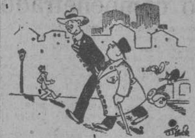
"RICOS", por MIRANDA

—¡La vida está carísima, amigo mío! —Es verdad. ¡A este paso llegará el día que nos quedemos sin un botón!