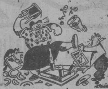
"PEPA", por MIRANDA