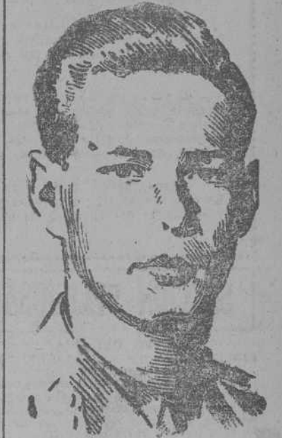
El Rey Miguel de Rumanía, cuya actuación se ve totalmente mediaticada por los enviados soviéticos, verdaderos dueños del país.

A últimos de octubre, el Gobierno inglés formuló ya una protesta cerca del Gobierno de Bucarest por la forma poco democrática de celebrar elecciones. Rumanía contestó a su vez con otra protesta, por considerar a dicha nota como una intromisión en los asuntos internos del país.—(EFE).