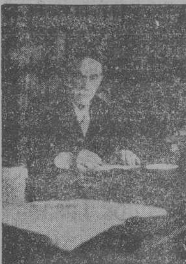
Don Pio Baroja, uno de los patriarcas de las letras españolas, a quien acaba de proponerse para el Premio Nobel de Literatura 1947. La "foto" recoge al ilustre novelista donostiarra, momentos después de haberse conocido la laudatoria noticia.