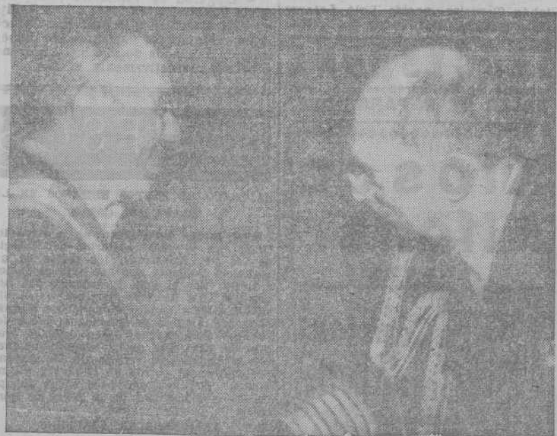
SANTIAGO.—El representante personal del Presidente Truman, almirante Leahy, felicita al Sr. González Videla (izquierda), después de las ceremonias celebradas con motivo de la toma de posesión de la Presidencia de Chile.