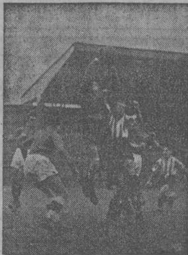
Argila, bloqueando un balón por sito, en uno de los muchos ascos a la portería ovetense

que he notado que no está concluido. El día que se termine pueden estar orgullosos de la obra.