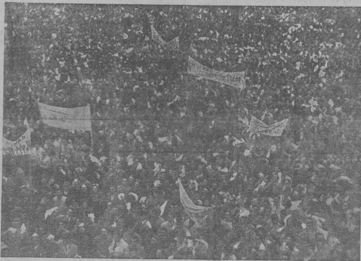
He ahí una gran parte del buen pueblo coruñés congregado ante el palacio de Capitanía General para dar fervoroso y público testimonio de su viril protesta contra las intolerables intromisiones extranjeras en los asuntos de nuestra Patria, y a la vez renovar su fe en el mandato de Franco