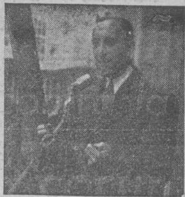
El Gobernador Civil, señor Martín Ballester, dirigiendo la palabra a los manifestantes, desde el balcón del Gobierno Civil

Durante el trayecto hasta Capitanía fue incesante el clamoreo de una multitud realmente enardecida. El nombre de España unido al de Franco, brotaba de todas las bocas.