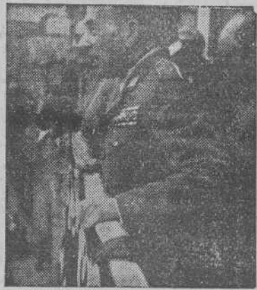
El Capitán General de la VIII Región Militar, señor Múgica Buhigas, habla a los coruñeses, que ocupaban totalmente la Plaza del General Franco.

Vuestra presencia aquí es la protesta clamorosa y vibrante, contra los que pretenden seamos vasallos suyos. Somos libres. Nos regimos y gobernamos como queremos. No admitimos imposiciones de extraños. No somos Colonia de ningún país, somos la nación que a más países ha dado vida. En una palabra, somos españoles: altivos, hidalgos, orgullosos y serios, y además