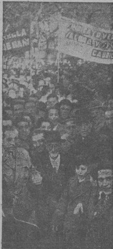
El ilustre escritor, Premio Nóbel de Literatura, don Jacinto Benavente, con algunos compañeros de la Sociedad de Autores, y en su representación, se une a la manifestación celebrada como protesta por la ingerencia de la ONU en los asuntos de España.

abad del Monasterio de Guadalupe, don Antonio Sanz. No obstante el tiempo desapacible, asistieron al acto los cuatro mil obreros de la factoría a los que se ha concedido un día de sueto, y otros varios millares de personas. Después de la ceremonia los invitados han sido obsequiados por la empresa constructora con un aperitivo.