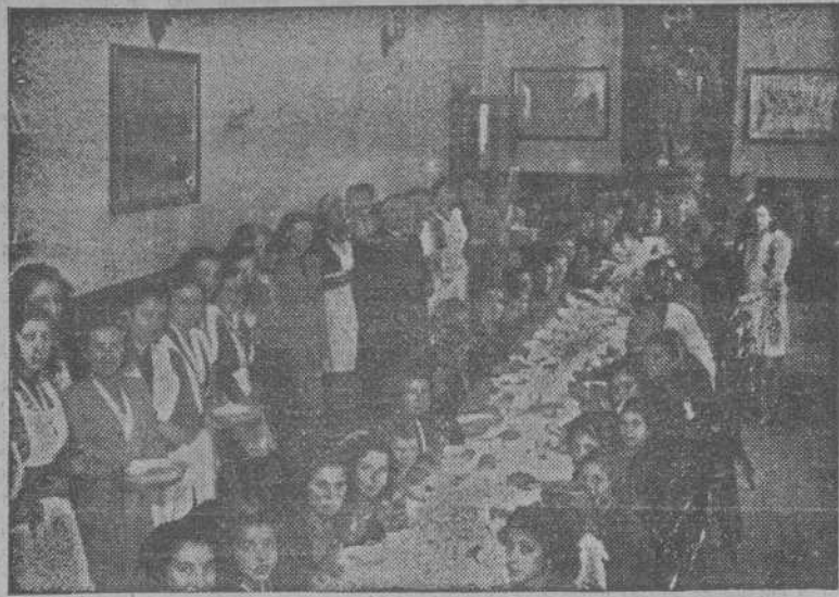
Las Hijas de María, conmemoraron la festividad de su Santa Madre. Además de los actos religiosos, obsequiaron con una abundante y suculenta comida a un centenar de pobres de San Roque de Afuera y San Pedro de Visma.

Con motivo de la festividad de la Inmaculada Concepción, las Hijas de María, que dirigen el Catecismo de San Roque de Afuera y Labañou obsequiaron con una comida de cuatro platos escogidos a ochenta menesterosos de aquella barriada. Con ello las abnegadas mujeres pertenecientes a dicha Congregación quieren que se convierta en óptima realidad su consigna de "Pan y Catecismo"; primero pan, ya que el hambre es mala consejera y con hambre mal se puede aprender el Catecismo ni ciencia alguna.