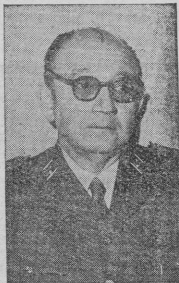
El general Vigón, ministro de Obras Públicas

Ayer a las cinco y media de la tarde, llegó, en automóvil, a Santiago, el ministro de Obras Públicas, general Vigón. Procedía de La Coruña y le acompañaba su distinguida esposa. A su llegada a Compostela, los señores de Vigón pasaron al Hotel de los Reyes Católicos, recibiendo el saludo del Alcalde de la ciudad señor Porto Anido. El Ministro acompañado