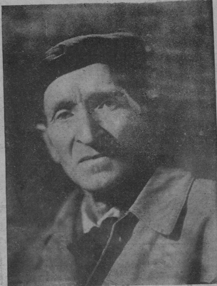
Los restos mortales del insigne escultor de la raza, don Francisco Asorey, reposarán para siempre en el Panteón de Gallegos Ilustres, en el templo de Santo Domingo. Dormirá el sueño eterno cerca de los sepulcros de Rosalía Castro y de Alfredo Brañas.

En la Facultad de Medicina ha sido colocada la Bandera a media asta.