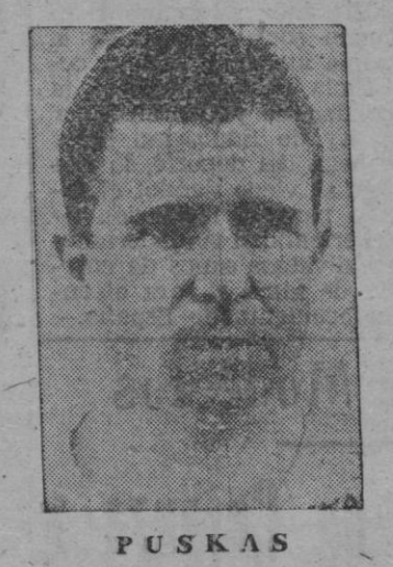
PUSKAS jugó con más nervio por parte atlética que madridista; y al Atlético le ganó el partido su línea media, que dominó el centro del terreno entonando al equipo completo, mientras al Madrid se lo perdieron sus volantes, que no existieron y arrastraron al fracaso a todo su cuadro. Apoteosis atlética final, con descenso al campo de muchos seguidores que cantaron el alirón junto a los jugadores alineados ante el Caudillo, que entregó seguidamente su trofeo a Collar. Y el Generalísimo fue despedido por la multitud, con idénticas muestras de simpatía y respeto con que había sido recibido.

Ha sido un auténtico partido de final de Copa. Como el de la temporada anterior, por ejemplo, y casi con idéntico resultado entre los dos equipos punteros de Madrid, se