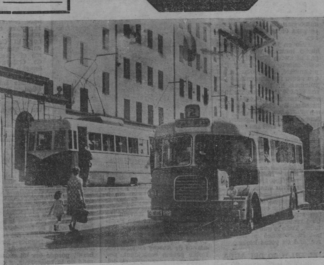
He aquí dos épocas de la vida ferrolana: el tranvía y el autobús.

Los viejos tranvías —en el caso de nuestra foto no se trata de uno muy viejo—, han dejado paso a los autobuses.