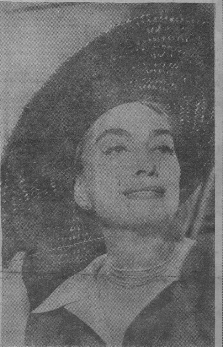
Al pie de la escalera del avión en que llegó a Barajas, Joan Crawford saluda con un gesto entre dulce y melancólico. La gran estrella de Hollywood, que llenó toda una época del cine norteamericano, se dedica actualmente a las finanzas.