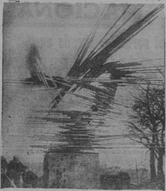
Desde el ángulo inferior de la fotografía, al fondo, los chiquillos observan entre curiosos y burlescos la escultura del artista Norbert Kricka, erigida en la ciudad alemana de Gelsenkirchen. Los muchachos parecen querer decir: ¡qué cosas hacen las personas mayores!