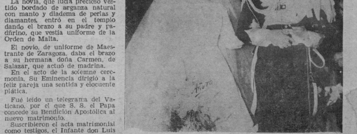
Los novios, al salir de la Capilla, después de la ceremonia de su enlace