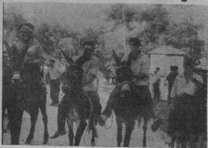
UN GRUPO DE PARTICIPANTES