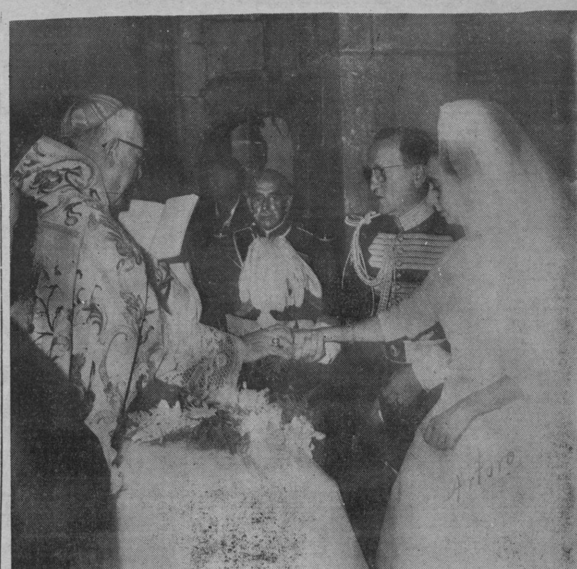
Un momento de la ceremonia religiosa en la Capilla del Alba.