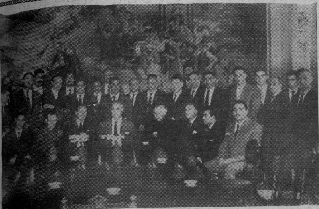
Grupo de directivos de los Círculos Culturales Vázquez de Mella y Hermandades de Antiguos Combatientes de los tercios de Requetés, de la Cruzada, que el domingo se reunieron en Santiago