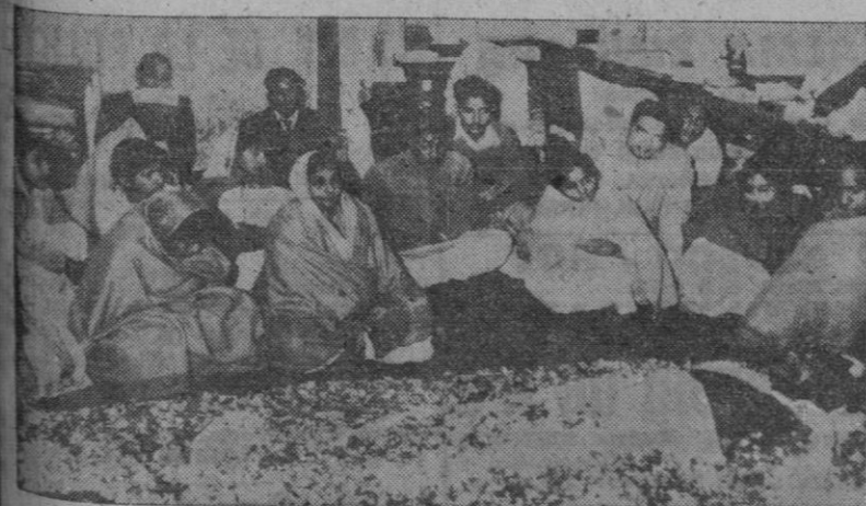
Los miembros de la familia rodean los restos del "Padre de la India", en la Casa de la India, donde se improvisó la última morada de Mahatma antes de llevar su cuerpo a la pira funeral. (Foto CIFRA).

En dicho puente se trabaja activamente para reparar los daños causados por el temporal. Centenares de obreros intervienen en los trabajos, fin de habilitar lo más pronto posible la línea férrea.—(CIFRA).