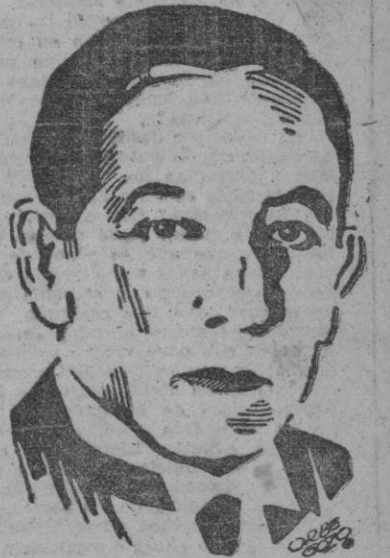
Presidente de El Salvador Don Salvador Castañeda Castro.

Entre las personalidades presentes en la Legación de España se hallaban el Presidente de la República, el Presidente de la Asamblea Nacional, los Ministros del Interior y de Cultura, el Arzobispo de San Salvador, el Subsecretario de Relaciones Exteriores y representantes diplomáticos acreditados en la capital salvadoreña.—(EFE).