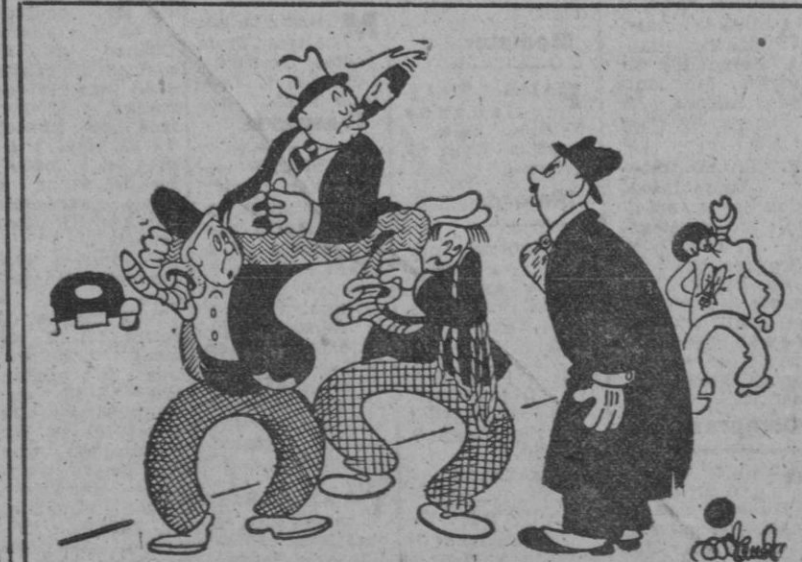
UN CASO, por Miranda

ROMA, 9.—El presidente central de los hombres de Acción Católica ha enviado una circular a todas las residencias de las diversas asociaciones nacionales, en la cual se propone la constitución de una federación internacional, con ocasión de los preparativos para el Año Santo de 1950. Dicha Federación tendría como tema los principios de "familia, Iglesia y trabajo". (EFE)