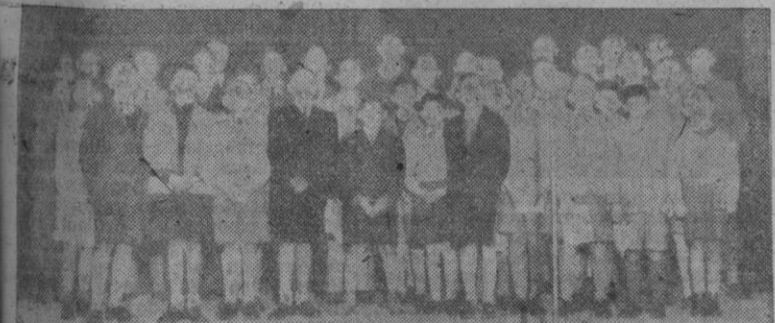
La Escolanía de los Estanislao que participó en el festival celebrado el domingo último por el Frente de Juventudes

El Frente de Juventudes celebró la "Mañana del camarada"