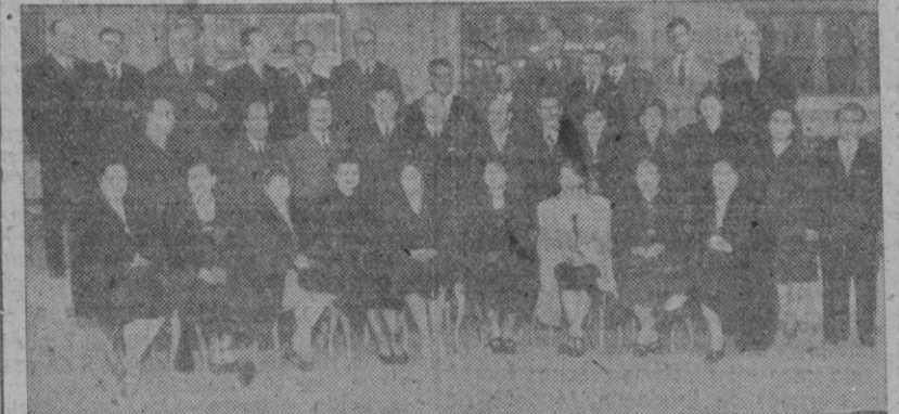
Odontólogos de La Coruña y Lugo que, con sus familias, celebraron la festividad de su Patrona, Santa Apolonia