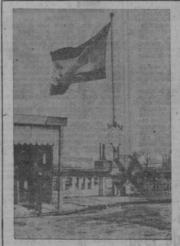
Una vista del puente internacional sobre el río Bidasoa, que separa España de Francia. En primer término, la barbeta del puesto fronterizo español echada. A la izquierda, izada la bandera española. Desde las cero horas de hoy, 10 de febrero, queda restablecido el régimen normal para el paso de viajeros, mercancías, y para las comunicaciones aéreas, telegráficas y postales.