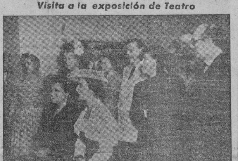
Visita a la exposición de Teatro

MADRID.—La esposa del Caudillo, doña Carmen Polo de Franco, acompañada por el ministro de Educación Nacional y su señora, la marquesa de Marín, visita la Exposición de Teatro, instalada en la Biblioteca Nacional.