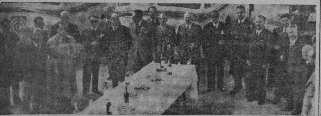
Grupo de consejeros e invitados que realizaron ayer tarde el primer viaje de La Coruña a Carballo en troleibús

CASABLANCA, 3.— El traslado de los restos del boxeador francés Marcel Cerdán, ha sido aplazado, pues el avión destinado a transportar los restos del cadáver de las víctimas del accidente aéreo de las Azores, no partirá hacia los Estados Unidos y regresará a Casablanca para traer a Cerdán a Casablanca.—(EFE)