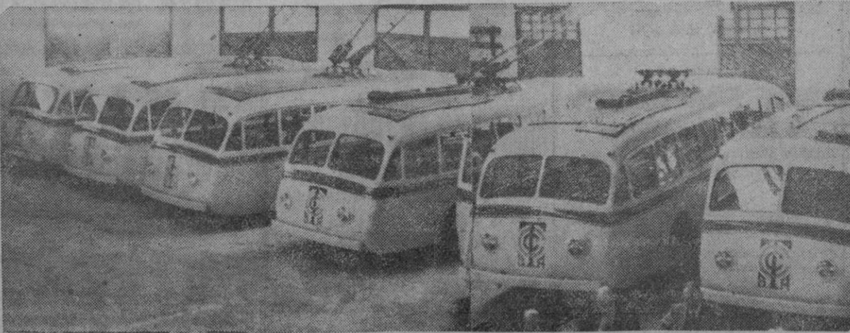
Seis de los grandes y cómodos trolebuses dispuestos para rodar entre La Coruña y Carballo. Otros cuatro idénticos a éstos están en los talleres de carrocería y preparados para completar su instalación eléctrica