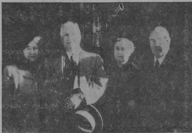
BURGOS.—Los senadores norteamericanos Mac Carran, a la izquierda, y Charles S. Dewey, acompañados de sus respectivas esposas, durante su visita a la Cartuja de Miraflores, donde saludaron a su compatriota el Padre Moore que recientemente formuló sus votos religiosos.