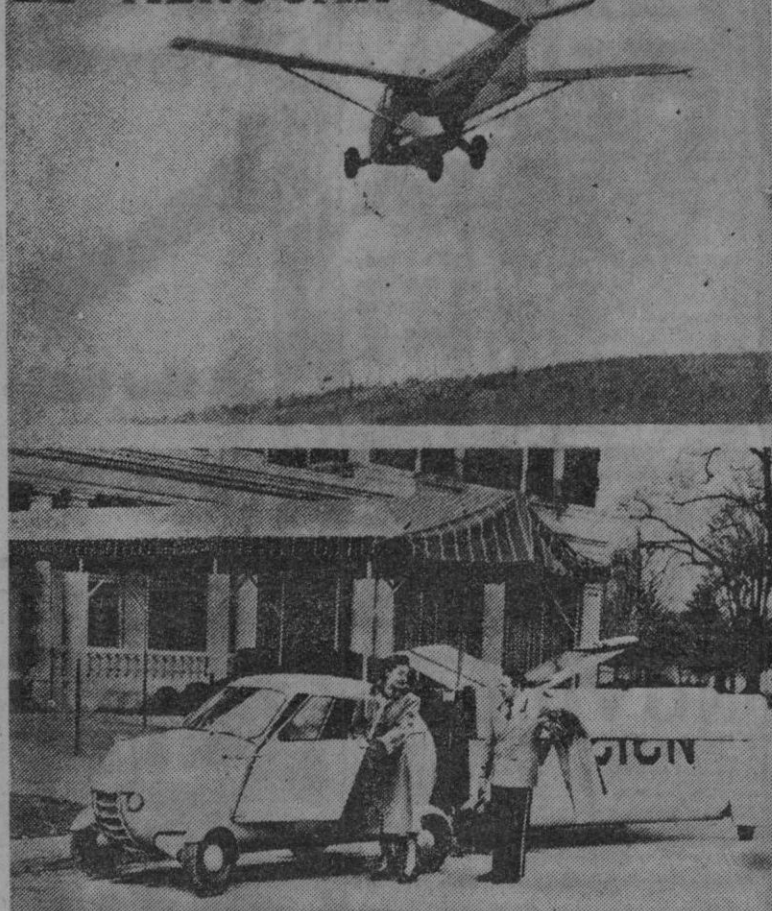
En los Estados Unidos se ha inventado un automóvil que puede convertirse fácilmente en aeroplano. En la fotografía aparece en tierra y volando