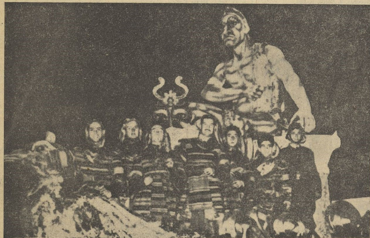
Tradicionalmente en Cartagena y por estas fechas tiene lugar una vistosa cabalgata que finaliza en la ceremonia llamada "quema de Judas" que reúne en el mismo interés a los cartageneros y a gentes venidas al efecto desde los pueblos vecinos. En ella figuran carrozas que simbolizan los pecados capitales. Una de ellas, "La Soberbia", aparece en nuestra foto.