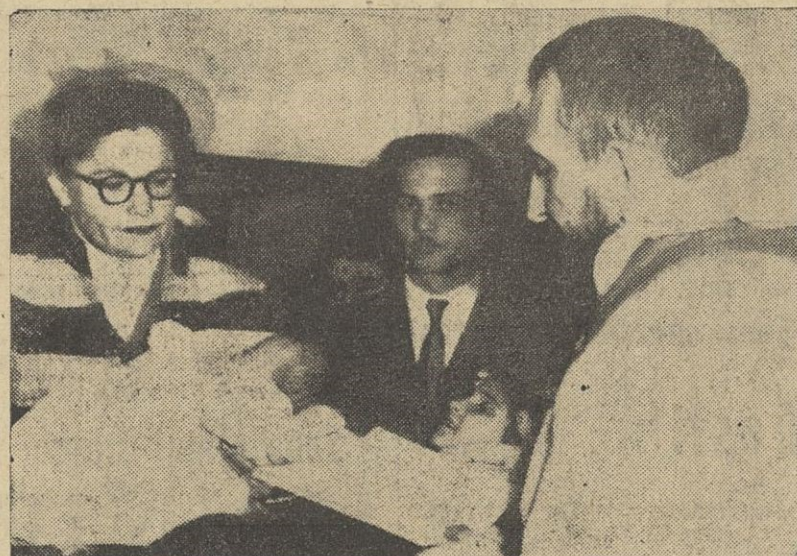
El "Abbe Pierre" celebró la Santa Misa el sábado de gloria en la capilla del suburbio de Pontault Combault, cerca de París. En la foto el abate bautiza a un recién nacido. En el centro un adulto que será bautizado juntamente con una niña de ocho años. La labor proselitista y social del P. Pierre cosecha cada día mayores frutos, espirituales y materiales.