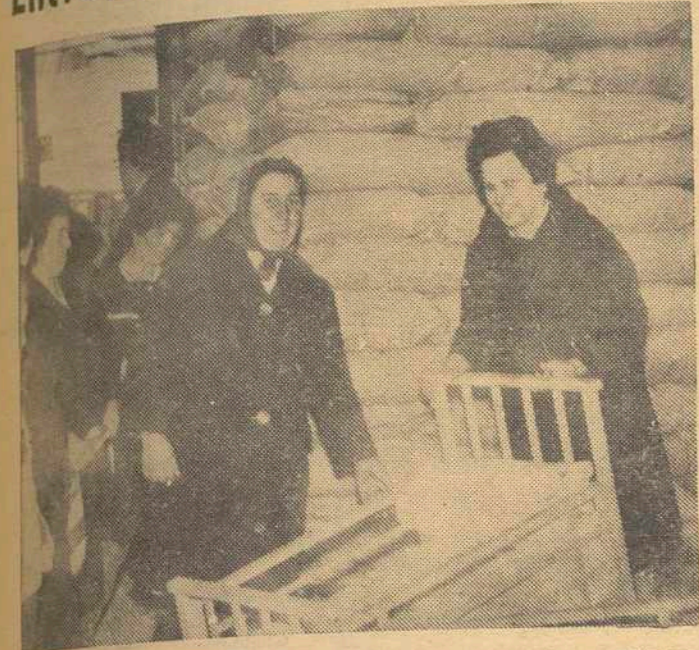
Entrega de cunas en las fiestas de Navidad de 1963, por Cáritas Diocesana.

42.000 PERSONAS ATENDIDAS EN 1963 EN LA DIOCESIS. — ¿SE SUPERARA EN ESTA COLECTA LA CANTIDAD DE 100.000 PESETAS? — PARA CONSTRUIR CIEN VIVIENDAS DESTINADAS A LOS POBRES SE PRECISAN 10 MILLONES DE PESETAS.