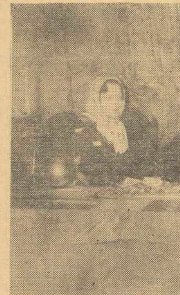
Una de las mesas peticionarias del Día Nacional de Caridad, del pasado año.

te el pueblo de Dios para rendir cuenta de la gestión que le ha sido encomendada y alargar la mano en favor de los necesitados. Todos somos miembros del Cuerpo Místico de Cristo y estamos obligados a colaborar en su reclutamiento. Esta cooperación hemos de prestarla dentro de la más consoladora y maravillosa realidad del cristianismo, cual es el dogma de la Comunión de los Santos que viene a decirnos que no estamos