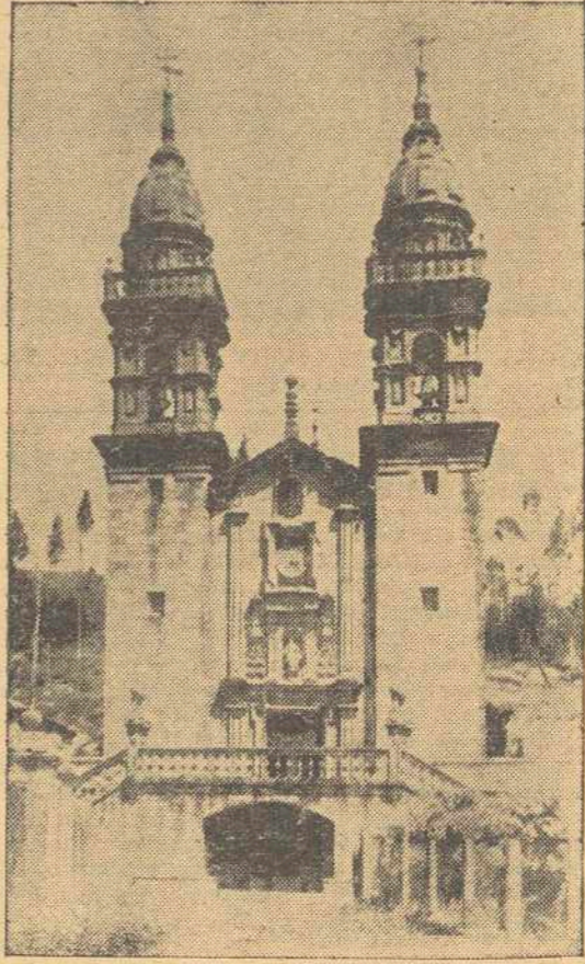
La iglesia de la Esclavitud. Se puede apreciar la valiosa balaustrada

El domingo de madrugada, sobre las cuatro, el camión de transporte de ganado, matrícula número C-19541, de la Empresa Gomez, de Santiago, que regresaba de Porriño, se fue sobre la escalinata del Santuario de la Esclavitud (Padrón).