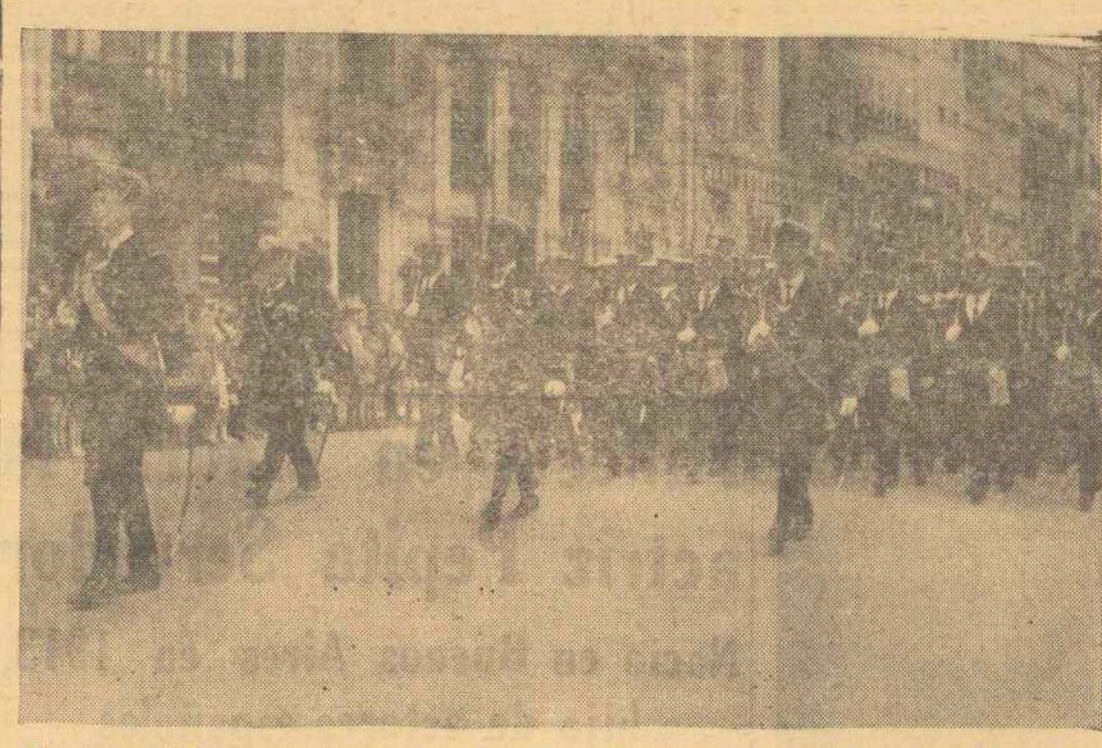
Las fuerzas de Marina de El Ferrol del Caudillo que participaron en el Desfile de la Victoria celebrado el domingo en La Coruña, desfilan por los Cantones.