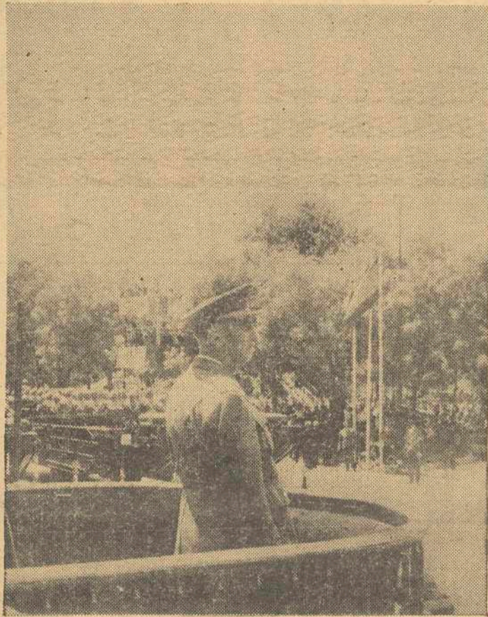
El Jefe del Estado, Generalísimo Franco, presenciando el paso de las tropas ante la tribuna.

NO TIENEN RELACION CON LA O.A.S. PARIS, 25. — La policía ha revelado que los interrogatorios preliminares a que han sido sometidos los tres individuos acusados del secuestro de la esposa del fabricante francés de aviones, Marcel Bloch Dassault, demuestran que no se hallan relacionados con la organización terrorista militar O.A.S.