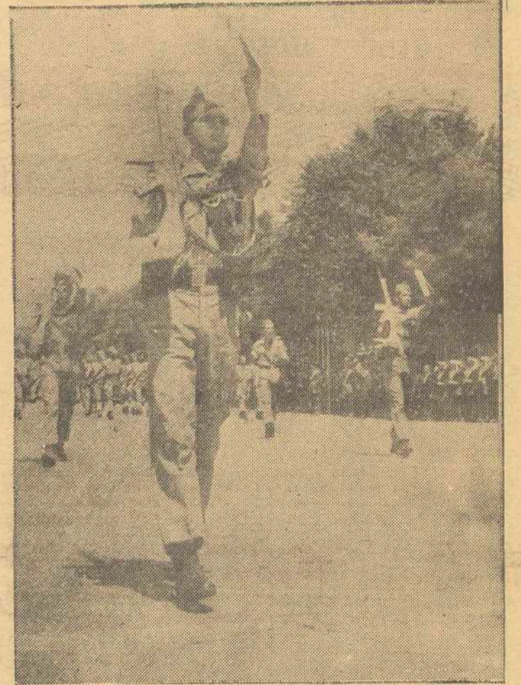
Catorce mil hombres y mil vehículos han participado en Madrid en el XXV Desfile de la Victoria, presidido por el Jefe del Estado, Generalísimo Franco. La IV Bandera de la Legión, desfilando ante la tribuna del Jefe del Estado.