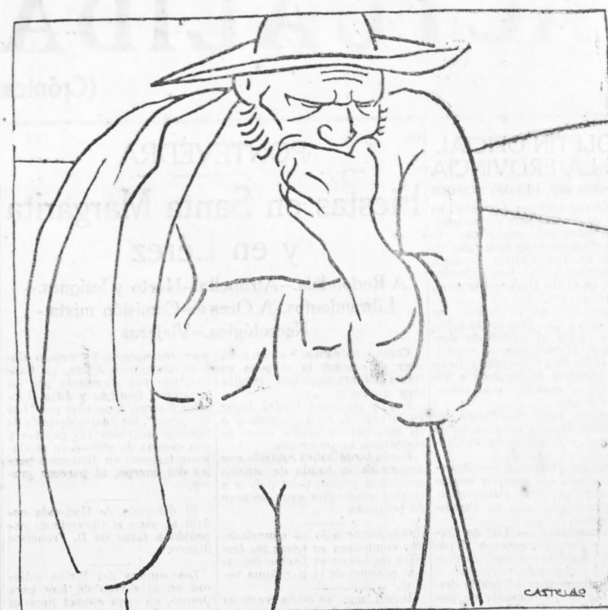
—¿Cómo hará Don Fulano pra ganar dez mil réas e aforrar cen mil?