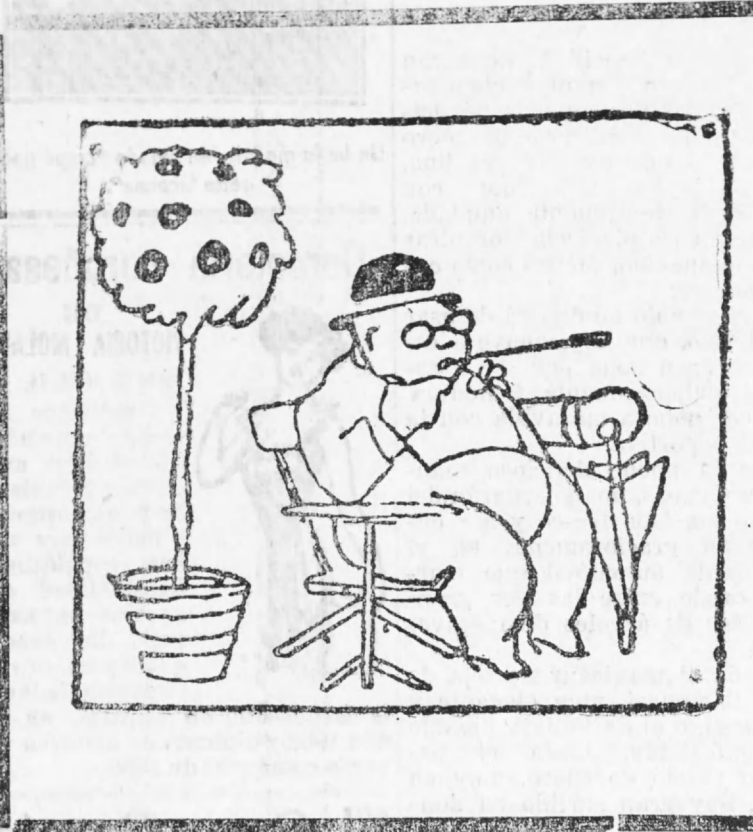
—Pues, señor; no me explíco cómo los espiritistas con siguen que venga Napoleón o César con sólo tocar una mesa. Yo llevo aquí dos horas golpeando ésta y ni siquiera viene el camarero.