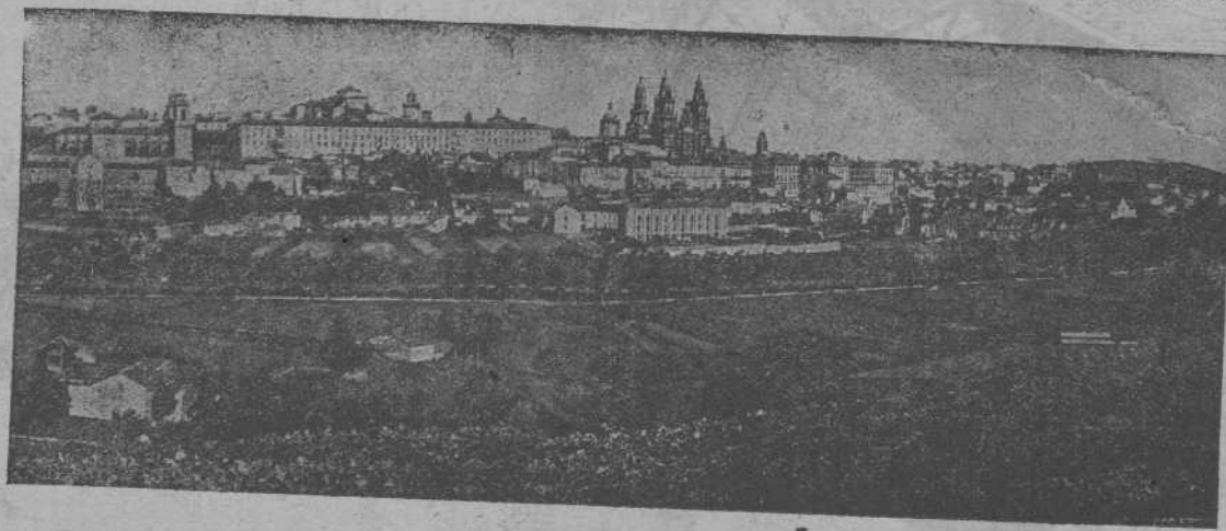
Santiago de Compostela, la ciudad de la fe y de la ciencia hermanadas, ofrécese activa y orgullosa de su rancio abolengo histórico, artístico y religioso.