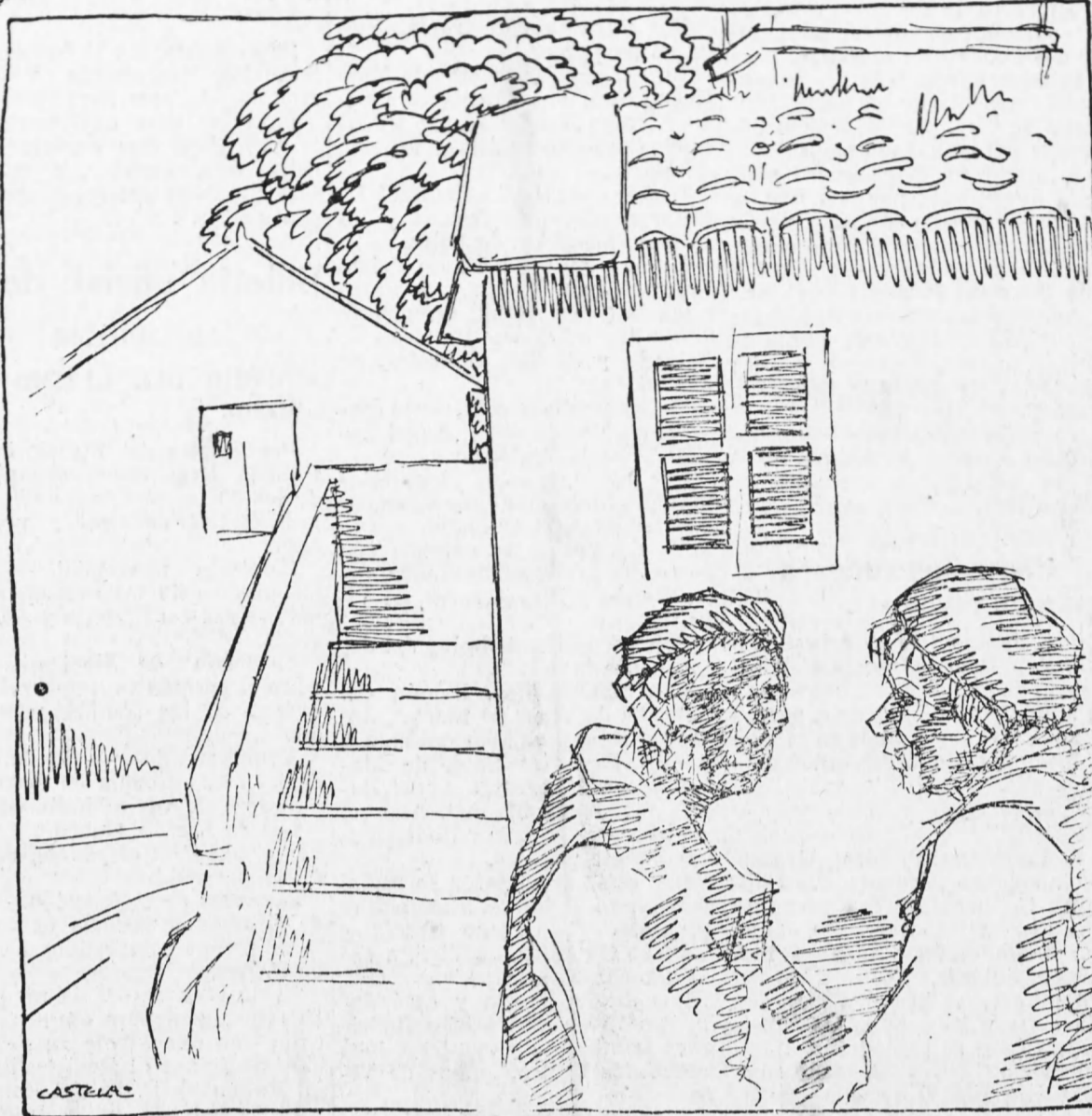
—¿TI ESTÁS COS DE ANTES OU COS D'AGORA? —EU ESTOUCHE COS DE DISPOIS.