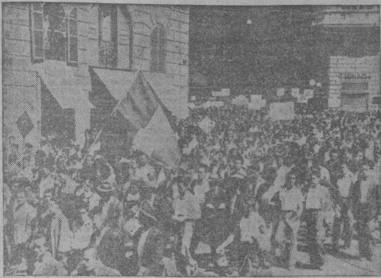
ROMA.—Una manifestación de campesinos de Italia central, por las calles de la capital italiana, pidiendo las sean cedidas nuevas tierras no trabajadas.