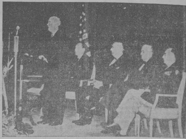
El Secretario de Estado norteamericano durante su discurso en la ciudad de Stuttgart, Alemania