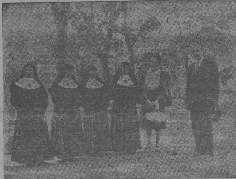
El Ministro de la Gobernación, don Blas Pérez González, Presidente del Patronato Nacional de las Hurdes, visita en Las Mestas el Hospital y Asilo de Ancianos, recientemente organizado por él, en el corazón de las Hurdes