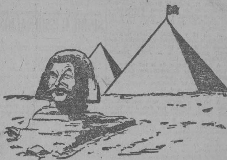
NUEVA VERSION DE UN VIEJO ENIGMA