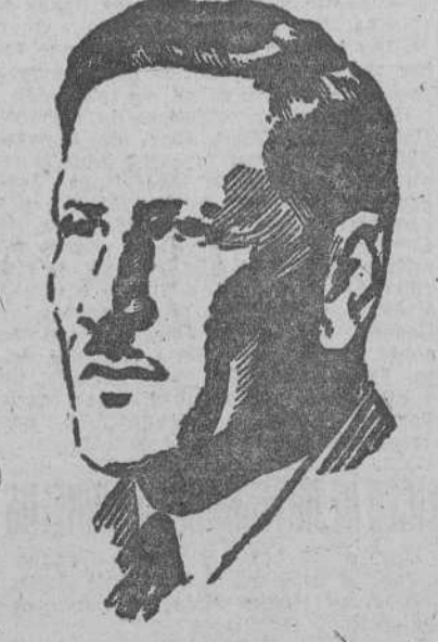
El general Auchinleck que se ha hecho cargo del mando del octavo Ejército británico que lucha en Egipto

Causa asombro contemplar el avance de las tropas germano-italianas a lo largo de la región costera del desierto africano. En sólo once días que median desde la caída de Tobruk, han sido recorridos más de quinientos kilómetros en constante persecución y con hábiles maniobras han ido cayendo sucesivamente el sistema defensivo de los desfiladeros de Halfaya, la plaza fuerte de Sollum, el campo atrincherado de Marsa Matruh y se combate ahora ante la última organización defensiva—Alamein—que existe en la