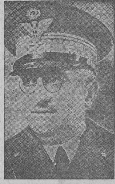
El jefe del Estado Mayor del Ejército Italiano en África del Norte, Ugo Cavallero, que ha sido ascendido al grado de mariscal, recientemente.