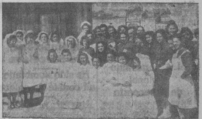
Camaradas de la Sección Femenina que concurren al cursillo de enfermeras inaugurado ayer en La Coruña.

Ayer, viernes, tuvo efecto, en el Salón de Actos de la Casa de la Falange, el acto inaugural del Curso de Enfermeras de Guerra organizado por la Regiduría de Divulgación y Asistencia Sanitaria-Social de la Sección Femenina en colaboración con el Servicio de Sanidad.