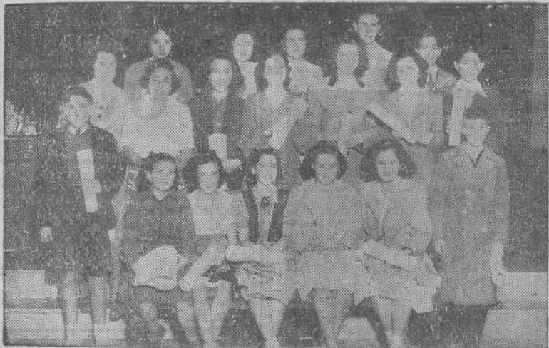
Alumnos de los Institutos de Enseñanza Media de La Coruña premiados en el pasado curso y que ayer recibieron los correspondientes diplomas