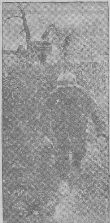
Este enlace alemán, aprovecha la maleza crecida en unas ruinas del sector del Wolchow, para que le sirvan como protección contra la visibilidad del enemigo

En el sector central del frente, el avance del Quinto Ejército norteamer-