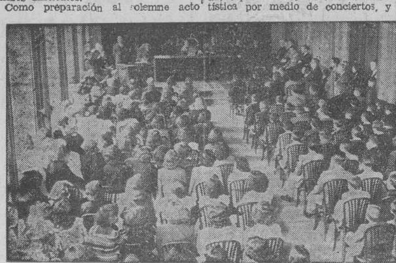
Aspecto del salón de actos del Instituto de Enseñanza Media, durante la apertura de curso.

Se celebró ayer a las doce de la mañana el acto solemne de la apertura del curso académico 1943-44 de los Institutos masculino y femenino de Enseñanza Media, de esta capital. El acto tuvo lugar en el paraninfo de dichos centros y asistieron autoridades, jerarquías, representaciones de centros docentes, y los alumnos y alumnas de ambos Institutos.