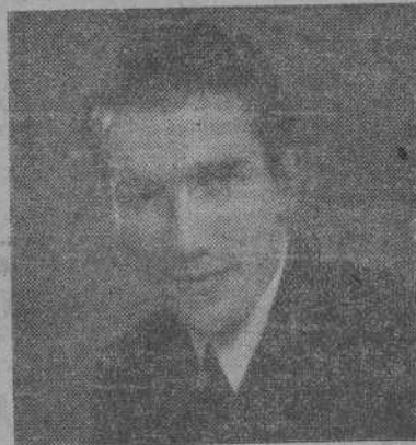
SANTIAGO.—El destacado artista santiagués Pedro Vidal Lombán que triunfa en la exposición de retratos en Compostela

Fueron el día 17 a la villa de Padrón un grupo de alumnos de la Escuela de Artes y Oficios con su director el notable artista don Angel Robles. En esta acogedora villa conocieron sus im-