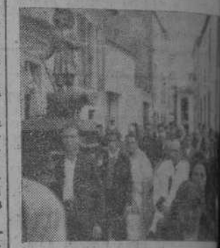
PADRON.—Un aspecto de la procesión dedicada a San Isidro Labrador celebrada en la villa de Padrón