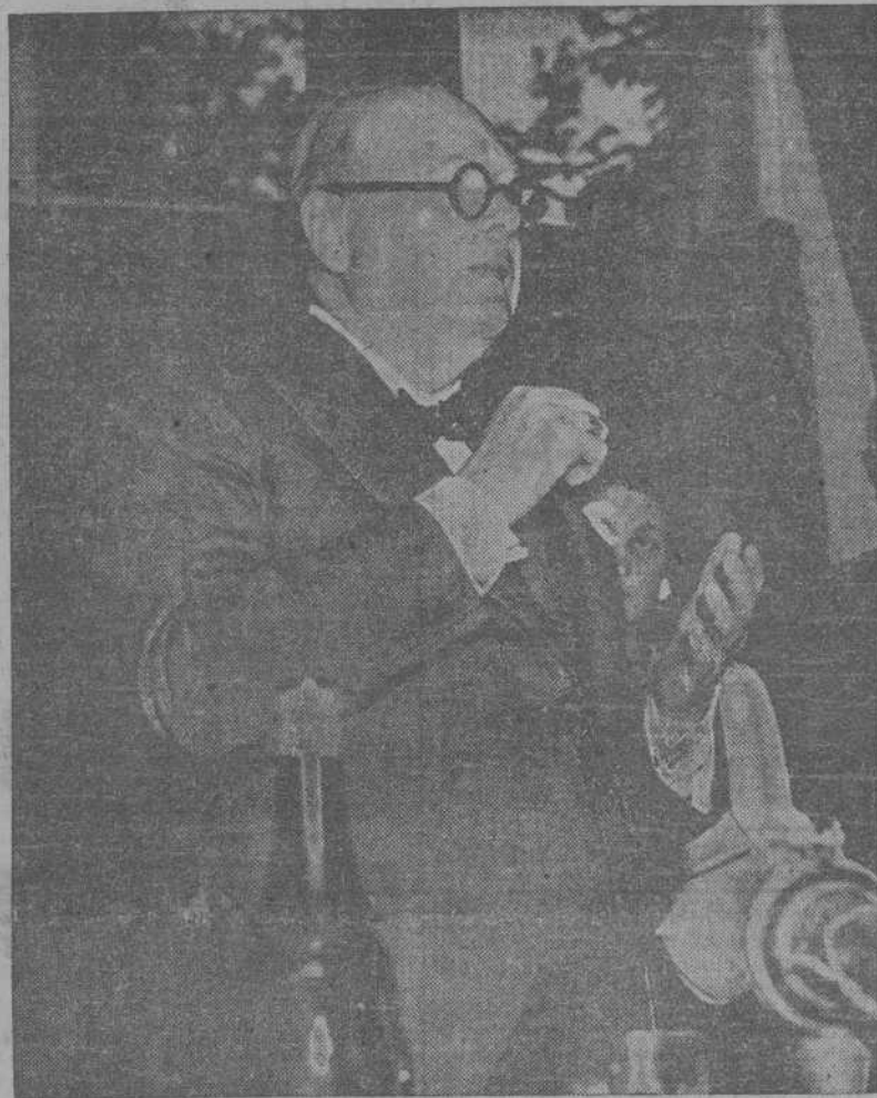
Una de las últimas fotografías del gran estadista inglés Winston Churchill