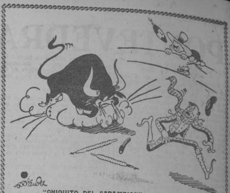
"CHIKUITO DEL SARAMPION", por MIRANDA En su primera "corrida" de la temporada

Pero debemos hacernos una advertencia. El plazo puede ser corto. Actualmente hay un respiro. Los cañones han dejado de disparar. La lucha ha cesado. Pero los peligros no han desaparecido. Si hemos de forjar los Estados Unidos de Europa o como se les llame, debemos comenzar ahora. En estos días presentes nos encontramos de manera extraña y precaria bajo el escudo de, yo diría, bajo la protección de la bomba atómica. Esta bomba se halla todavía solamente en manos de un Estado y una nación que sabemos todos que no la utilizará más que en defensa del derecho y de la libertad. Pero muy bien puede suceder que dentro de pocos años este terrible agente de destrucción se difunda y la catástrofe, que siga a su utilización por varias naciones en guerra no solamente ponga fin a todo lo que llamamos civilización, sino que incluso desintegre la Tierra misma. Debo ahora concretar las propuestas que he presentado ante vosotros. Nuestra finalidad constante debe ser crear