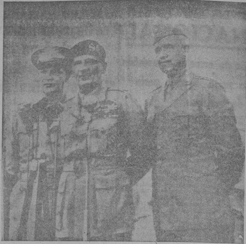
WASHINGTON.—Lord Montgomery, vizconde de El Alamein, con el general norteamericano Eisenhower, jefe supremo de los Ejércitos aliados durante la guerra, y el general Bradley, a su llegada al aeropuerto de la capital