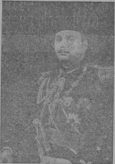
EL REY FARUK

Estos temores y aprensiones han sido dados a conocer con toda claridad al rey Faruk, y algunos de los jefes árabes han ido tan lejos como a indicarle que, hasta cierto punto, Egipto demuestra ser egoísta—en defensa de sus intereses nacionalistas—al comprometer la independencia de todos los países árabes del Oriente Medio.