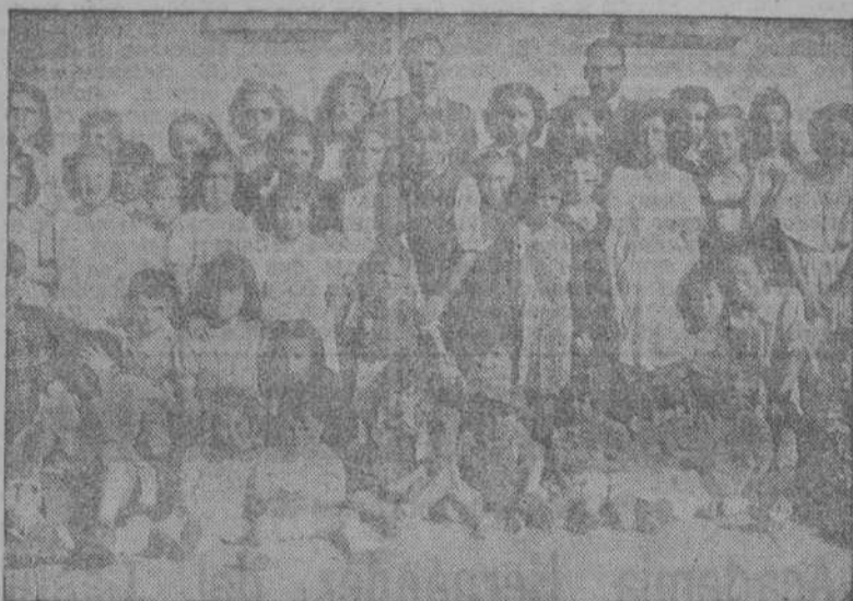
Grupo de hijos de reclusos en la Prisión Provincial de La Coruña, que participaron en los diversos actos celebrados con motivo de la fiesta de Nuestra Señora de la Merced

Con motivo de la festividad de la Excelsa Patrona de Prisiones, Nuestra Señora la Virgen de la Merced, se celebraron ayer en la prisión provincial de La Coruña diversos festejos.