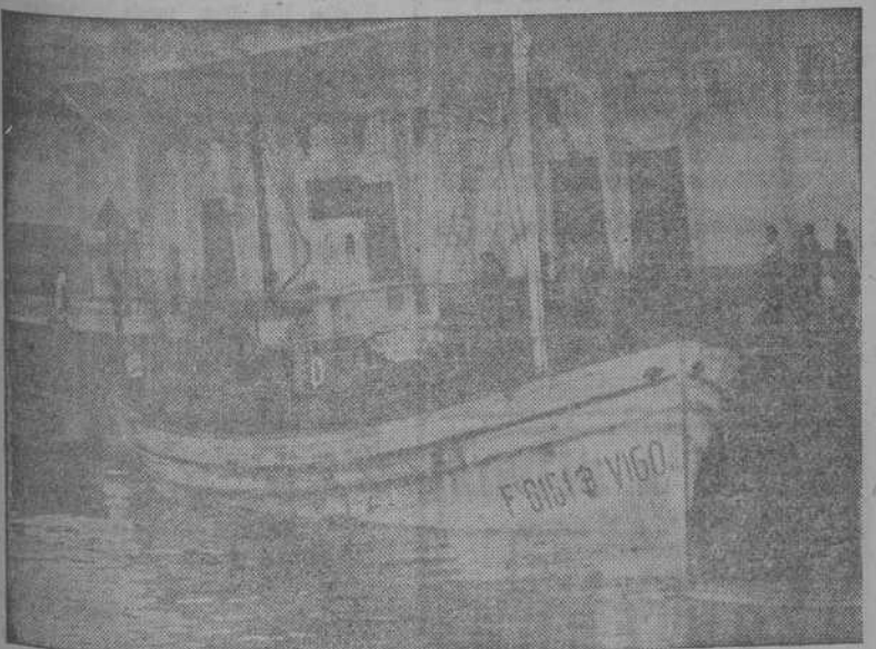
El vapor pesquero "Mary-Zoila", al que se daba por desaparecido en el Gran Sol, atracado en el muelle de la Palloza

La pastoral condena "las mentiras materialistas de los librepensadores que son divulgadas en las escuelas y en los salones de conferencias y en las cuales se hace mofa de la doctrina de Cristo, afirmando que todo lo que afirma la Iglesia no es más que un mito. No ha planteado la Iglesia—termina el documento episcopal—conflicto alguno con las autoridades del Estado. Pedimos a Dios que ilumine con sus verdades aquellos que rigen a nuestro país para que aprendan a conocer que el Estado solo florece cuando los ciudadanos se sienten satisfechos.—(EFE).