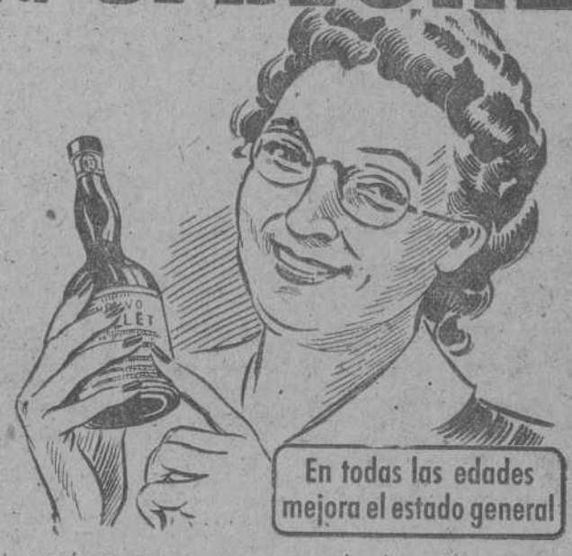
En todas las edades mejora el estado general

Todos, más o menos, vamos acumulando en la sangre toxinas que disminuyen nuestras defensas contra las enfermedades. Por ello se recomienda la limpieza periódica del organismo con Depurativo Richelet, conocido en el mundo entero por su actividad contra