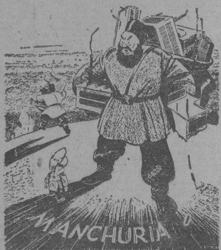
NO HABLE CHINO