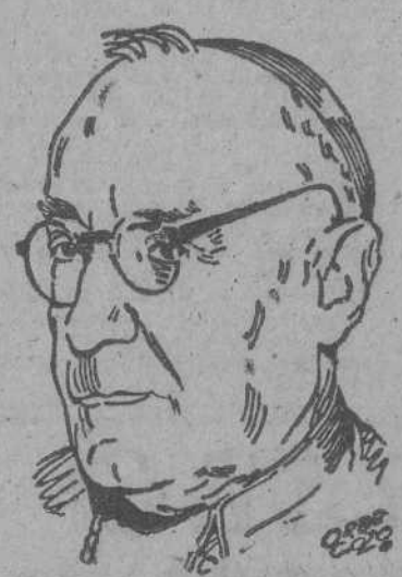
DR. PLA Y DENIEL

TOLEDO, 16.—En el Palacio Arzobispal se ha facilitado esta tarde la siguiente nota: "El Eminentísimo Sr. Cardenal Arzobispo de Toledo y Primado de España, ha hecho constar ante el mundo su protesta formal por el vil atropello cometido contra la libertad religiosa e independencia de la Iglesia, ante la injusta y sectaria condena de Monseñor Stepinac, Arzobispo de Zagreb y Primado de Croacia, elevan a Su Santidad protesta contra tal atropello libertad religiosa e independencia Iglesia y ofrendan a Su Santidad testimonio de filial adhesión y de estrecha fraternidad entre todos los miembros Cuerpo místico de Cristo, Cardenal Primado España". Los católicos españoles empiezan a manifestar su viva indignación producida por sentir heridos los más delicados y profundos sentimientos religiosos y la conciencia nacional católica de nuestra Patria. El Eminentísimo Sr. Cardenal Primado durante su estancia en Zaragoza y Madrid, ha recibido patentes muestras de ello. Asimismo ha recibido el siguiente telegrama: "Acción Católica burgalesa protesta indignada crámen seudolegal Monseñor Stepinac, renovando firmísima adhesión Iglesia Católica, Presidente".—(CIFRA).