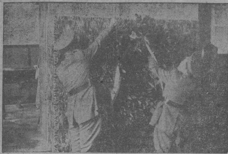
La Octava Agrupación de Intendencia, que guarnece La Coruña, celebró ayer, a las once, en la iglesia de San Jorge, una misa de requiem por los fallecidos del Cuerpo. Después fué colocada una corona de laurel ante la lápida de los Caídos, leyéndose la oración de ritual. Con ello dieron fin los actos organizados en honor de la Patrona, Santa Teresa de Jesús.