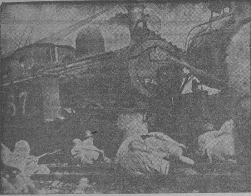
Parapetados tras estas locomotoras, los soldados japoneses combaten a las fuerzas enemigas que guarnecen la pequeña estación del ferrocarril.