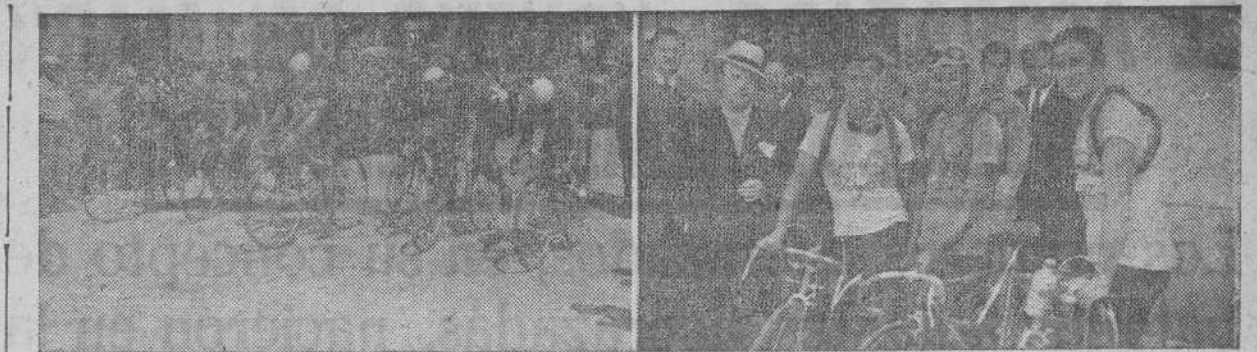
LA IV VUELTA CICLISTA A ESPAÑA.—El equipo del Deportivo que participa en esta prueba. — La salida de los corredores para realizar la etapa La Coruña - Vigo

SANTIAGO, 16.—Décima y última lista de los alumnos admitidos en el ejercicio escrito, y que pueden tomar parte en el examen oral. Esta lista comprende desde el número 1.026 al final: 1.026 1.029 1.032 1.037 1.038 1.039 1.040 1.041 1.042 1.043 1.044 1.048 1.050 1.051 1.052 1.053 1.054 1.057 1.058 1.066 1.070 1.072 1.076 1.077 1.078 1.079 1.080 1.088 1.090 1.091 1.092 1.094 1.098 1.099 1.102 1.103 1.108 1.113 1.114 1.115 1.116 1.117 1.118 1.119 1.121 1.123 1.128 1.131 1.134 1.135 1.138 1.140 1.148 1.152 1.153 1.156 1.157 1.160 1.162 1.163 1.165 1.168 1.169 1.172 1.173 1.174 1.175 y 1.176.