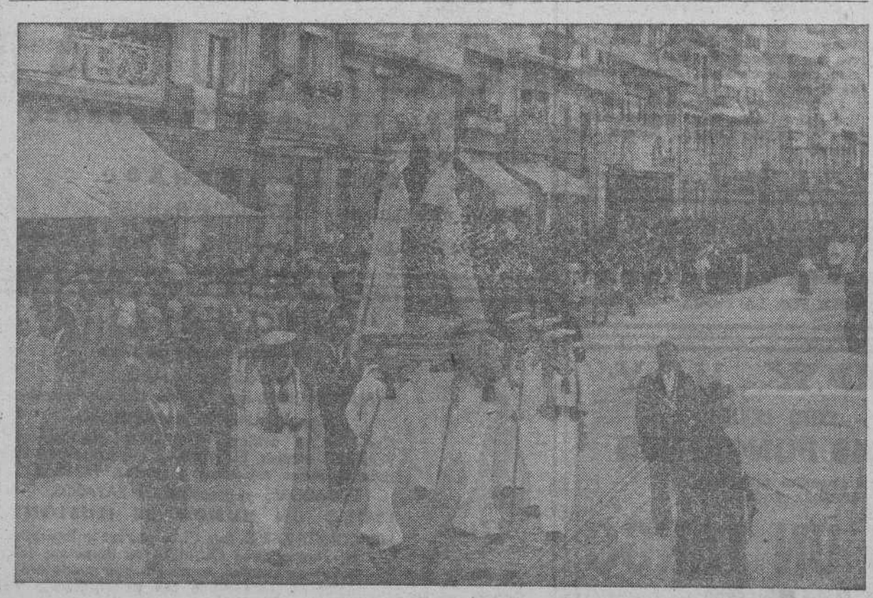
Un aspecto de la procesión de la Virgen del Carmen celebrada ayer con gran esplendor en La Coruña.

PARTE ALEMANA GRAN CUARTEL GENERAL DEL FUHRER 16.—El alto mando de las fuerzas armadas alemanas comunica: "En el sector Sur del frente oriental continúan sin tregua los combates de persecución. Los grupos cercados e incommunicados del enemigo han tratado en vano de abrirse paso hacia el Este y nuestras tropas les han infligido enormes pérdidas. Las cifras de bajas soviéticas y del material de guerra capturado o destruido no han podido ser establecidas todavía. Poderosas formaciones del Ejército aéreo han atacado intensamente