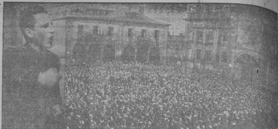
En la Plaza de los Literarios, de Santiago, se celebró el día 18 un importante acto de afirmación Nacional-Sindicalista, en el que tomaron parte el jefe comarcal, el jefe de Investigación, el alcalde de Santiago y el jefe provincial del Movimiento

Por su parte, el periódico "Curentul" dice: "No hay que olvidar que la lucha que hoy libran las potencias del Eje y sus aliados contra Rusia, la inició España, por sí sola, hace varios años, bajo el mando del general Franco. Si no hubiera sido por el Caudillo español, Europa se encontraría hoy ante una grave amenaza de infiltración comunista. Ese aniversario encuentra a un país hispano en los umbrales de un sendero sembrado de gloria y de fe cristiana".