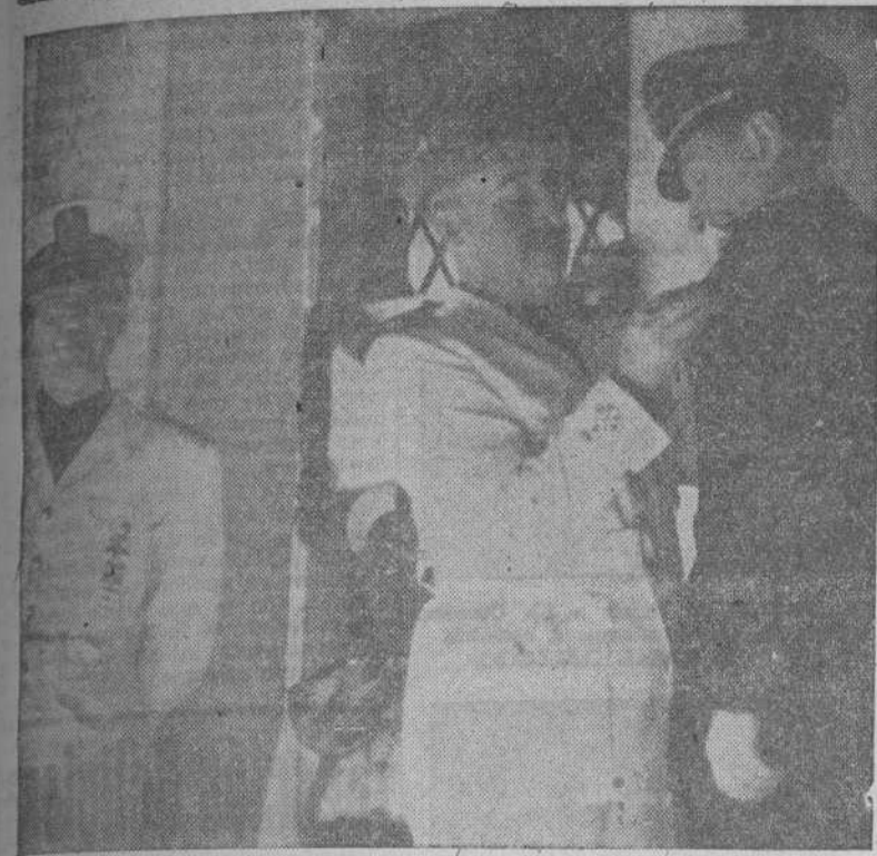
Sr. E. el Jefe del Estado, imponiendo la Medalla de la Vieja Guardia al Secretario General del Partido, don José Arrese