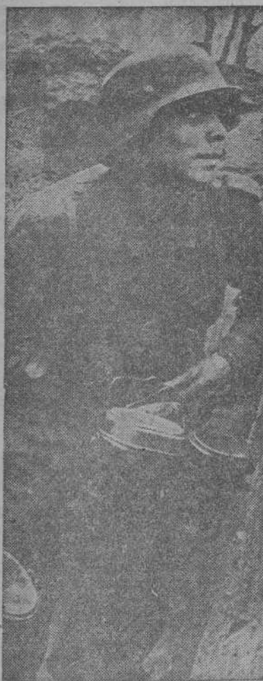
Este granadero alemán, escondiéndose lo más posible del fuego, lleva el alimento a sus camaradas que combaten en primera línea.