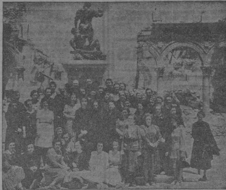
El Consejo Superior y representantes de las Diócesis, en su visita a Toledo, al terminar la semana de estudios, ruinas del Alcázar