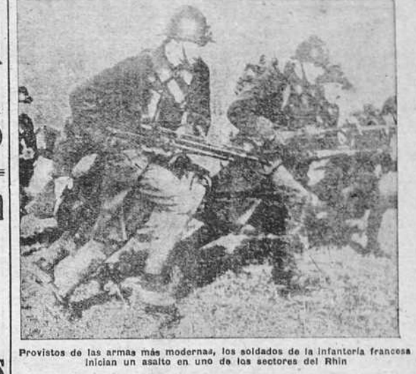
Provistos de las armas más modernas, los soldados de la infantería francesa inician un asalto en uno de los sectores del Rin

HELSENKI, 4.—Se calcula que a consecuencia de la gravedad del momento, el capital finlandés sólo quedará un 8 por 100 de la población normal.