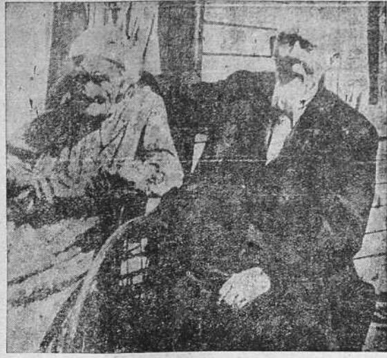
UN MATRIMONIO MODELO.—Vive en San Lucas (Iowa, Estados Unidos), y tanto la esposa como el marido cuentan 93 años. Hace 78 que se casaron y sólo se separaron una vez: con ocasión de la guerra civil norteamericana. Desde entonces han vivido ejemplarmente, y son objeto de la estima y consideración de sus vecinos.