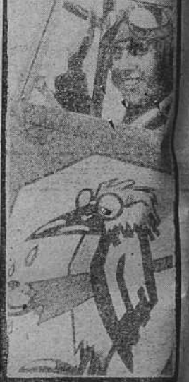
Este avión de caza alemán lleva instalado en uno de sus lados el famoso paraguas de Chamberlain

Los aviones alemanes de reconocimiento volaron sobre Forbach, tanto en el bosque de Wardat, como inmediatamente al Norte, en dirección a Sarrebruck. Los aparatos ligeros de bombardeo que son los que con preferencia emplean los alemanes para el reconocimiento volaron sobre la llanura alsaciana y especialmente sobre las ciudades de Colmar y Mulhouse.