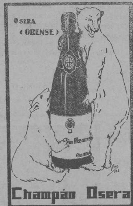
DE VENTA EN PRINCIPAL/ULTRANARINO/