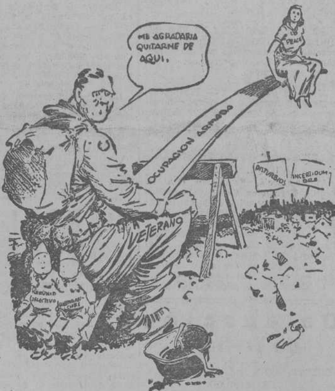
—Si, si, pero no podemos dejar bajar a esa dama.

El intercambio comercial, interés mutuo de España e Inglaterra Nuevas facilidades para exportar anchoas, en salazón