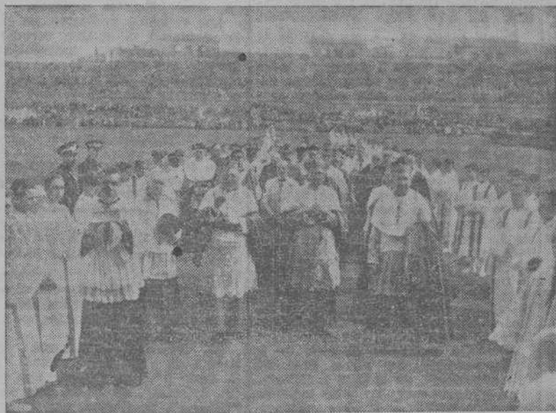
El Nuncio de S. S., el Cardenal-Arzbispo de Tarragona y el Obispo de la Diócesis, se dirigen a saludar a las autoridades, una vez finalizado el acto de clausura del Congreso, durante el cual fué escuchada la alocución de Su Santidad.

PRIMER CONGRESO CATEQUÍSTICO EN BARCELONA